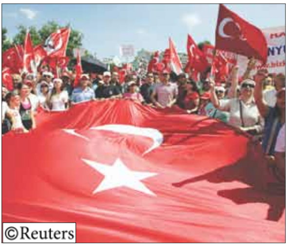
من مؤيدي حزب العدالة والتنمية التركي