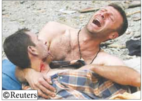
جرحي الحرب في أوسيتيا

وفقا لاتفاق تقدمت به الحكومة الأفغانية في السابق وفيه وافق غينيس، فإن الجيش الوطني الأفغاني سيضعاف على مدى خمس سنوات قادمة ليتجاوز تعدادها 120 ألف جندي. وقال مسؤولون في البيتاغون إن مثل هذه الزيادة لن تكون ممكنة دون تمويل أمريكي يغطي تكاليف التدريب والإمداد والغذاء، وذلك سيسعى غينيس إلى طلب الدعم من الحلفاء لتوفير 20.0 مليار دولار