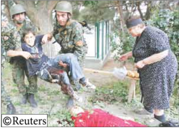
الأقل قتلا في القتال الدائر بين القوات الجورجية والانفصاليين الذين تدعمهم روسيا في إقليم أوسيتيا الجنوبية المتطرف.

وكان عدد القتلى السابق يبلغ 40 شخصا. ويشمل الرقم قتلى من المدنيين والعسكريين. وقال المصدر الذي طلب عدم ذكر اسمه إن نحو 748 شخصا جرحوا.