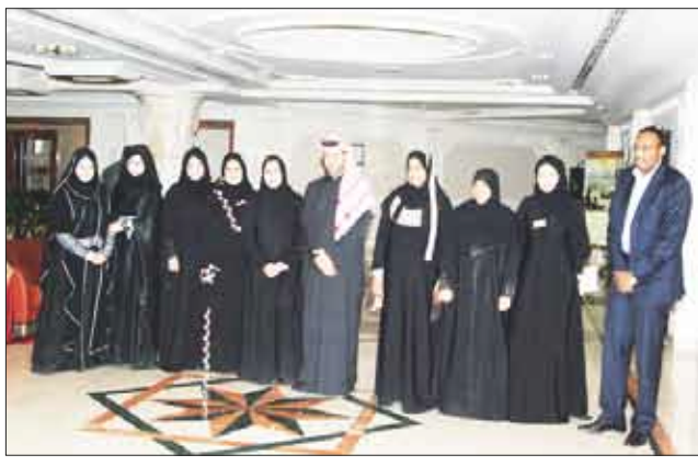
مجلس سيدات الأعمال بالشارقة

بحثت اللجنة التنفيذية لمجلس سيدات الأعمال بالشارقة وإدارة جمعية مرشدات الإمارات /مفوضية الشارقة/ سبل التعاون والدعم المتبادل بين المؤسستين لخدمة الأنشطة والفعاليات التي تساهم في تنمية وخدمة المجتمع بصورة عامة والمرأة بصورة خاصة والمنتجات المنتجة على وجه الخصوص.