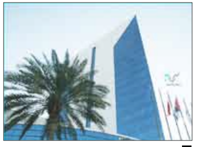
دبي / ديسمبير

دوره في تعزيز التقارب الاقتصادي والتعاون المشترك بين دبي وهامبورغ وتمهيدا للبدء في إقامة مشاريع مشتركة في قطاعات اقتصادية مختلفة كقطاع التجارة الخارجية والخدمات اللوجستية وقطاع البنوك والتمويل وقطاع الطاقة المتجددة وقطاع العناية الصحية قطاع تقنية المعلومات والإعلام.