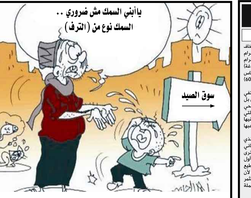
يا أبني السمك مش ضروري .. السمك نوع من (الترف)