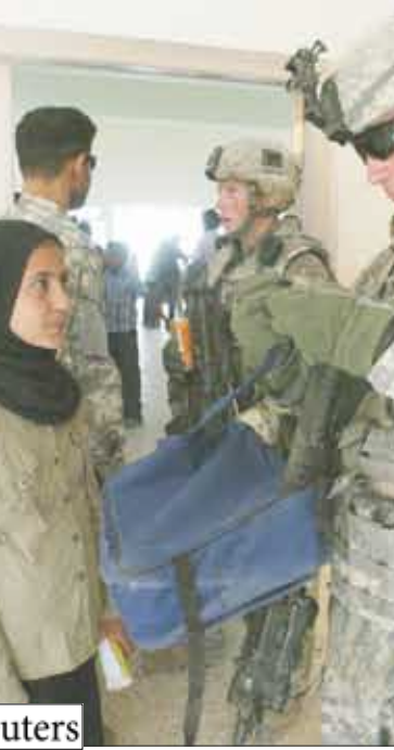
جنود يتحققون من هويات المواطنين العراقيين

الكثير من النساء الانتحاريات ضحايا للاغتصاب وهو زعم يصعب التحقق من صحته.