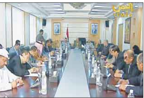
المحافظات الجنوبية والأعمال والتحديات الراهية من قبل القادة التي تستدعي تعزيز التعاون الأمني بين الدول العربية بشكل عام وتبادل المعلومات بشأنها. وأشار إلى أن الآثار السلبية التي تخدم الإرهابيين وتشعرهم بنجاح مخططاتهم في إلقاء الأمن والإضرار بالاستقرار والتنمية. كما استعرض الوزير القربي خلال لقائه السفراء العرب بصنعاء قضية الانتخابات البرلمانية التي ستجري في إبريل القادم والحراك السياسي القائم لتجسيد الممارسة الديمقراطية في اليمن. وأشار بهذا الصدد إلى الحوار الجاري بين المؤتمر الشعبي العام وأحزاب اللقاء المشترك لضمان تهئية المناخ الأمني المناسب للاستحقاق الدستوري في موعده، وقال: «إن هناك اتفاقاً بين المؤتمر والمشاركين حول مختلف القضايا الرئيسية على طاوله الحوار.»

أكد وزير الخارجية الدكتور أبو بكر القربي حرص اليمن على تفعيل آليات التشاور الدائم بين الدول العربية الشقيقة والتنسيق المشترك بينها لما من شأنه خدمة قضايا الأمة العربية وتعزيز تطوراتها الديمقراطية والاستقرار والتنمية. وقال القربي خلال لقائه أمس سفراء الدول العربية الشقيقة لدى بلادنا: «إن هذا اللقاء يأتي لإطلاع السفراء على مجمل التطورات الداخلية والإقليمية والدولية في إطار الجهود التي يبذلها فخامة الأخ الرئيس علي عبدالله صالح رئيس الجمهورية لرأب الصدع العربي والتوفيق بين حركتي فتح وحماس الفلسطينييتين وكذا التوفيق بين الحكومة الصومالية المؤقتة وتحالف المعارضة.» واستعرض الدكتور القربي جهود