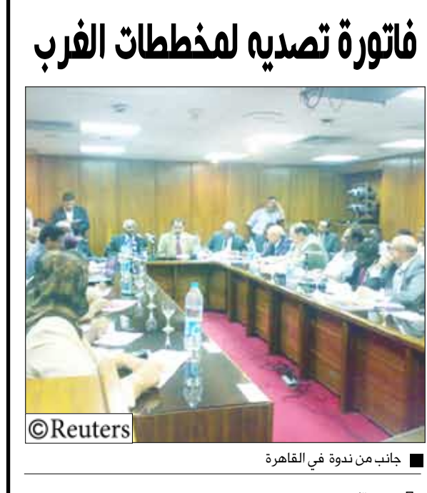
جانب من ندوة في القاهرة

القاهرة/مبايعات: أكد سياسيون وخبراء قانونيون أن السودان يدفع ضريبة وقوفه في وجه المخطط الغربي لتفتيت المنطقة الذي امتد إليه بعد أن كان بدأ بلبنان والعراق.