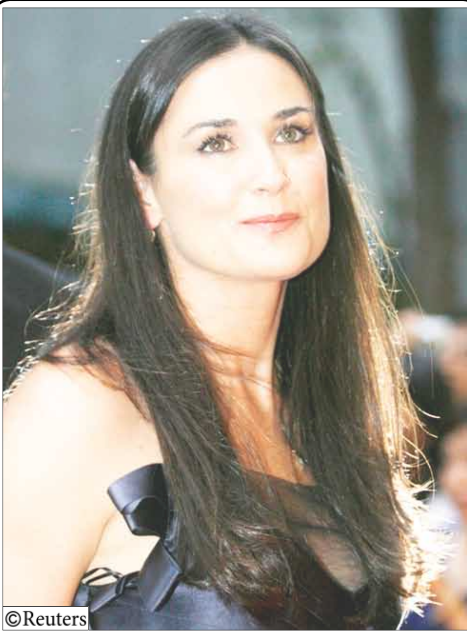
وصول الفنانة "ديما مور" مع زوجها "اشتون كاتشر" لإعلان فيلمها "ماذا يحدث في فيغاس" في طوكيو أمس .

□ الصالح /مثنى الحضوري : شدد الأخ/ الحسون صالح مصبح وكيل محافظة الصالح على القائمين على المراكز الصيفية في المحافظة ضرورة العناية بالشباب والعمل على تكثيف المحاضرات واعدادهم إعداداً جيداً لما يعكس النفع لهم والفائدة من خلال إيجاد المناخات الملائمة لممارسة كافة الأنشطة والفعاليات وكذا توفير الإمكانيات والوسائل المناسبة لتحقيق النجاح للمخيمات الشبابية لتحسينهم من الأفكار الهدامة التي لا تبنى المجتمعات . وكان الأخ وكيل المحافظة قد قام بزيارة تفقدية للمراكز الصيفية رافقه خلالها الأخ/ منصور حمود مدير مكتب الشباب والرياضة في المحافظة وإطلاعاً على مستوى أداؤها والصعوبات التي يواجهونها واحتياجاتها.