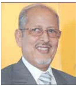
الرئيس الموريتاني ولد الشيخ

وزرائه ووزير الداخلية أمس الأربعاء، وتجمع الجنود في القصر الرئاسي بعدما أقال عبد الله ضباطا كبارا بالجيش في وقت سابق أمس في إطار أزمة سياسية.