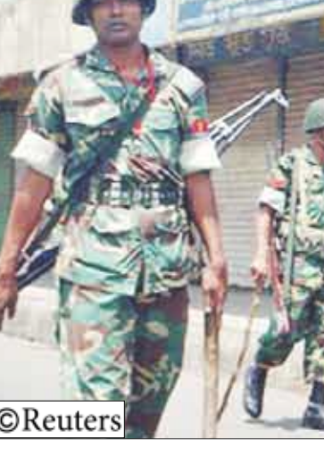
جنود باكستانيون في الحدود مع أفغانستان

إسلام آباد 14 أكتوبر/أكتوبر: أفاد بيان رسمي أن الحكومة الباكستانية التي تولت السلطة قبل أربعة أشهر علقت مرسوما صدر الشهر الماضي يمنع جهاز المخابرات الداخلي القوي والمثير للجدل التابع للجيش تحت إمرأة وزارة الداخلية.