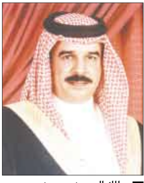
ملك البحرين حمد بن عيسى

الصادقين. كما أشاد بالنتائج المثمرة للزيارة الحالية التي يقوم بها جلالتهم إلى تركيا ومباحثاته مع كبار المسؤولين الأتراك والتي سيكون لها انعكاساتها الإيجابية على صعيد تعزيز التعاون الاقتصادي والتجاري بين البلدين الصديقين. وغير الملك عن اعترازه بالإنجازات التي تحققت في القطاعات الاقتصادية والتجارية في البلاد والتي تشكل مؤشرا هاما في نمو اقتصاد المملكة وتعزيز مركز البحرين التجاري الهام في المنطقة.