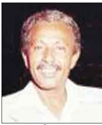
محمد سعد عبدالله

كما لا ينسى الجميع بأن من سعد شاعر وكلنا نتذكر جميعاً كلمة ولو جبر خاطر و بناس ردا حيايبي وروحي. كما نتج ابن سعد بامتياز في تقديم الموشح والأغنية الصناعية مع الفرق الأكاديمية والمحلية، ودون أن تفقد ملامحها الفنية. رحم الله فناننا اليميني الكبير محمد سعد عبدالله في الذكرى السادسة لرحيله.