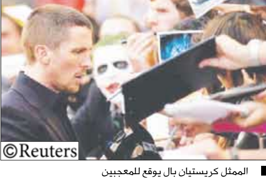
الممثل كريستيان بال يوقع للمعجبين