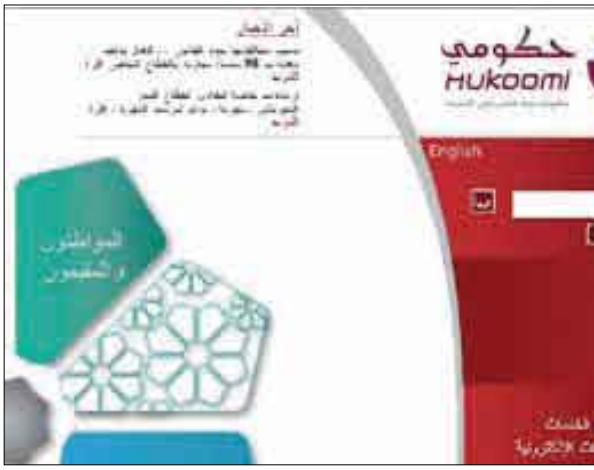
قطر تحتل المركز الخامس في تطبيق الحكومة الإلكترونية عالميا

موقع إلكتروني دولي وهو ما أهلها لتكون في المركز الخامس بعد كل من الإمارات والكويت والبحرين ولبنان في تصنيف الأمم المتحدة للدول الرائدة على مستوى العالم في تطبيق مفهوم الحكومة الإلكترونية.