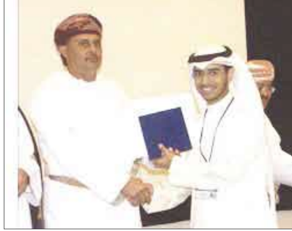
قطر تشارك في ختام فعاليات المنتدى البيئي لدول مجلس التعاون

قطر تشارك في ختام فعاليات المنتدى البيئي الشبابي لدول مجلس التعاون