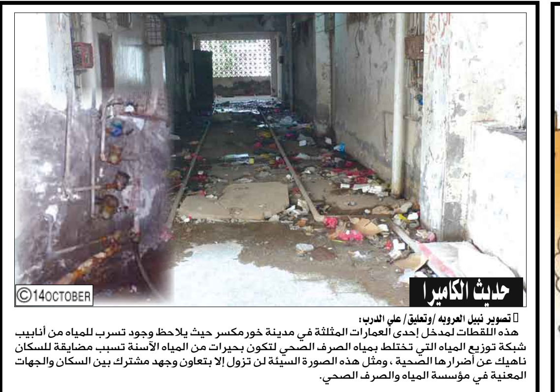
حادثة الكاميرون تعليق / علي الدرب: هذه القلعة لمدخل إحدى العمارات المثلثة في مدينة خورمكسر حيث يلاحظ وجود تسرب للمياه من أنابيب شبكة توزيع المياه التي تخلط بمياه الصرف الصحي لتتكون بحيرات من المياه الأسنة تسبب مضايقة للسكان ناهيك عن أضرارها الصحية ، ومثل هذه الصورة السنية لن تزول إلا بتعاون وجهد مشترك بين السكان والجهات المعنية في مؤسسة المياه والصرف الصحي.