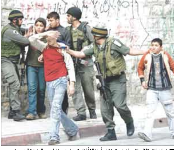
قوات الاحتلال الإسرائيلي تعتقل أطفالا أثناء توغل في نابلس بالضفة الغربية