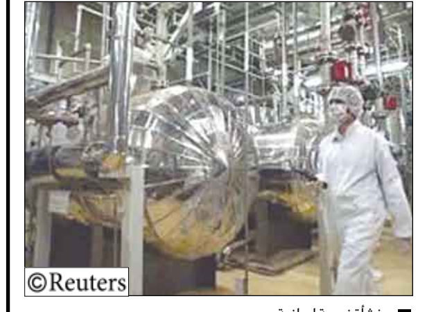
منشأة نووية إيرانية

تونس/طهران/14 أكتوبر/رويترز: توقع الزعيم الليبي معمر القذافي أمس الثلاثاء انه لن يكون بمقدور إيران الصمود في حال اتخاذ قرار دولي ضدها قائلًا إن ما تقوم به حاليا ليس سوى مكابرة. وقال القذافي الذي كان يتحدث أثناء منحه دكتوراه فخرية «ما تقوم به إيران مجرد مكابرة ولو أن هناك قرارا ضدها فسنبكون مصيرها نفس مصير العراق.» وقال الزعيم الليبي توقعه بانها إيران في حال شنت ضدها حرب «بان التحديات أكبر من قدرتها على مواجهتها لوحدها.» وطرقت القذافي إلى موضوع إيران أثناء حديثه عن ضرورة قيام «دول قومية» عبارة عن كتلتات قوية تجمع عدة دول مضيافا أن «الدول الوطنية» التي لا تندمج في فضاءات إقليمية ستندثر. «واعتبر القذافي أن «إيران ليست أقوى من العراق» وقال انه لا يمكنها أن تصمد.» واستدل بمصير يوغوسلافيا السابقة نتيجة عزلتها الدولية وقال «من كان يتصور أن يوغوسلافيا يمكن أن تخفي في رمشة عين.» وتهدد واشنطن وإسرائيل باللاجء للخيبار العسكري ضد إيران بسبب أنشطتها النووية في حال فشل الحل الدبلوماسي. ويتهم الغرب إيران بتطوير برامجها النووية سرا بينما تقول إيران إنها بصدد تطوير طاقتها النووية لتغايات تكنولوجية سلمية. في غضون ذلك صرح مصدر مسئول في المجلس الأعلى للأمن القومي الإيراني أن الرسالة التي جرى تسليمها لمسئول السياسة الخارجية في الاتحاد الأوروبي خافيير سولانا أمس لم تكن ردا على حزمة الحوار الغربية.