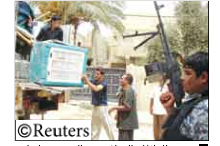
هروب العائلات العراقية من الحدود مع إيران