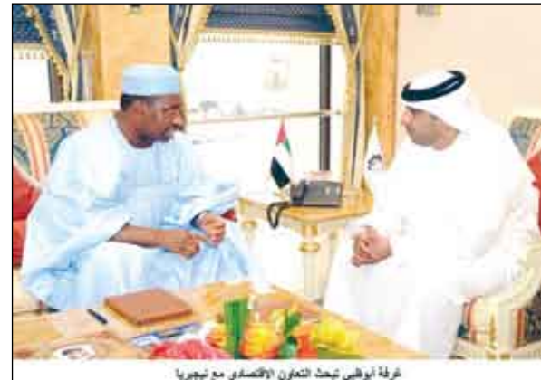
غرفة أبو ظبي تبحث التعاون الاقتصادي مع نيجيريا

في مجال الشحن الجوي..كما أن شركة الاتحاد للطيران ستبدأ في نهاية هذا العام بتسيير خط مباشر للطيران بين أبو ظبي والعاصمة النيجيرية "ابوجا".