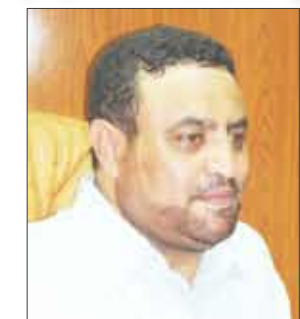
حمود محمد عباد

كاستاد المكل الرياضي الدولي، فيما يجري العمل لتنفيذ إستاد مدينة سينوا، مشيراً إلى الإعلان عن المرحلة الثانية من مشروع إستاد عمران الدولي ومشروع مدرجات ملعب حجة وكذا تنفيذ ملعب في مدينة المحويت". وبين الوزير عباد أنه سيتم الإعلان أيضاً عن مناقصة بناء المسبح الأولمبي بصنعاء ومضمار للهنج والفروسية بحضور، كما يجري العمل بوتيرة عالية حالياً في تنفيذ مشروع نادي الوحدة بصنعاء بإشراف شخصي من الوزير حسب تأكيده ، إلى جانب العديد من المشاريع الأخرى المرتبطة باستضافة اليمن لخليجي 20 في محافظتي عدن وأبين .