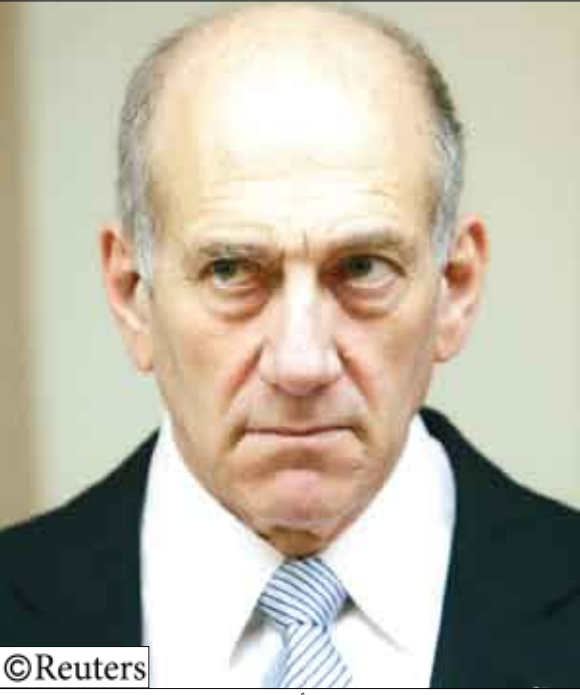
رئيس الوزراء الإسرائيلي إيهود أولمرت

فلسطين المحتلة/14 أكتوبر/رويترز: يجتمع رئيس وزراء الاحتلال الإسرائيلي إيهود أولمرت والرئيس الفلسطيني محمود عباس في القدس اليوم الأربعاء بعد أسبوع من إعلان أولمرت أنه سيتنحى عن منصبه الأمر الذي ألقى مباحثات السلام التي ترعاها الولايات المتحدة في حالة من التخبط. وقال مساعدون لرئيس الوزراء إن أولمرت يفضل الإفراج عن بعض السجناء الفلسطينيين من سجون الاحتلال الإسرائيلية كلفتة طرية لعباس لكنهم لم يقدموا المزيد من التفاصيل. وقال المفاوض الفلسطيني صائب عريقات إن اجتماع أولمرت وعباس سيحدد في مقر أولمرت الرسمي في القدس المحتلة، وأضاف «سيستمر الرئيس عددا من المسائل مثل قضايا الوضع الدائم وحواجز التفقيش والسجناء.» ووافقت حكومة الاحتلال الإسرائيلي يوم الأحد على الإفراج عن خمسة سجناء فلسطينيين في إطار اتفاق لمبادلة السجناء بزم مع حزب الله اللبناني وتسلمت إسرائيل بموجبه رفقات جنديين إسرائيليين.