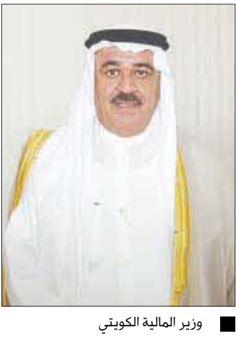
وزير المالية الكويتي