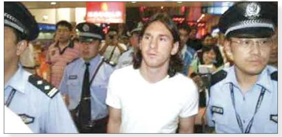
الارجنتيني ليونيل ميسي

مدريد / متابعات: أعلن نادي برشلونة الإسباني لكرة القدم أن مهاجمه سيرتدي القميص رقم "10" الذي كان يحمله لاعبه السابق البرازيلي رونالد دينيرو المتنقل إلى ميلان الإيطالي. وكان ميسي (21 عاماً) يرتدي حتى الآن القميص رقم 19. علماً أن القميص رقم 10 كان دائماً من نصيب أبرز اللاعبين في الفريق، وسيتشارك ميسي مع منتخب بلاده في دورة الألعاب الأولمبية في بكين، في حين يقوم برشلونة بجولة استعدادية للموسم الجديد في الولايات المتحدة.