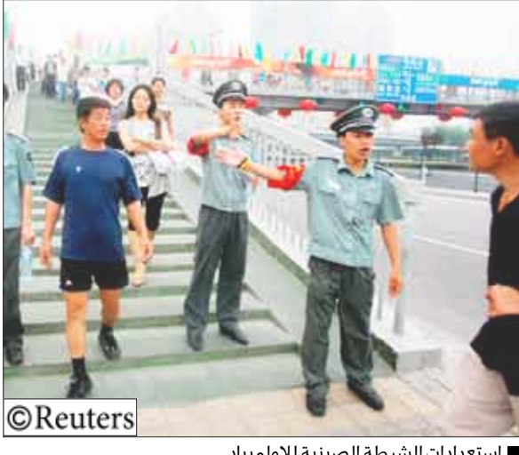
استعدادات الشرطة الصينية للأولمبياد