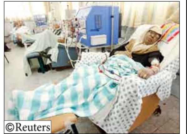
بعض المرضى الفلسطينيين في غزة