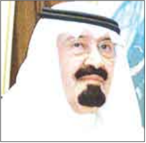
الملك / عبدالله بن عبدالعزيز

غير مسبوقة لبلانه وفق رؤى واضحة تستصحب الخبرات والتجارب وتوظفها في إطار قيم مجتمعنا لتحقيق طموحاته في تعليم يتسم بالمرونة والقدرة على التجدد.