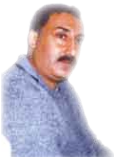
الشاعر العراقي / حسين الهاشمي