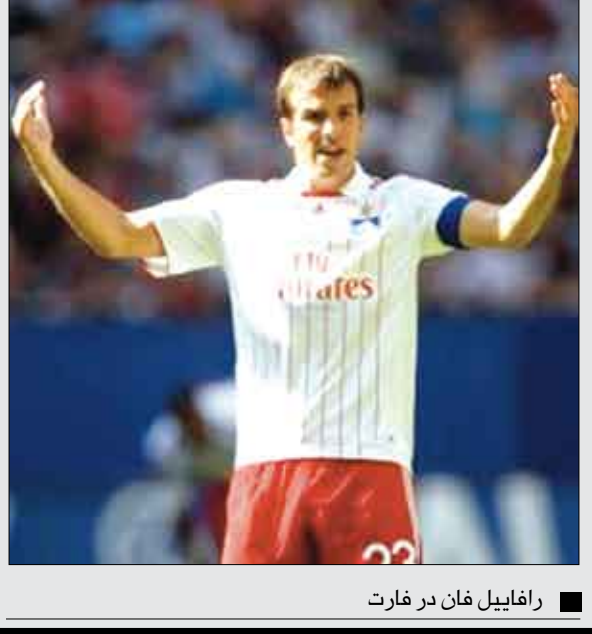
رافاييل فان در فارت

ذكرت إذاعة "كاديلا سبير" الإسبانية أن ريال مدريد تعاقده مع المهاجم الهولندي الدولي رافاييل فان در فارت من نادي هامبورغ الألماني مقابل 9 ملايين يورو. وأوضحت الإذاعة التي دائما ما تكون السباقة في إعلان الصفقات الكبرى التي يجريها النادي الإسباني العريق: "سيحصل النادي الألماني على مبلغ 9 ملايين يورو بالإضافة إلى مليونين إضافيين بحسب النتائج". وأشارت الإذاعة إلى أن ريال مدريد سيقدم لاعبه الجديد إلى الصحافة الاثنين المقبل بعد المشاركة في كأس الإمارات المقررة غدا الأحد في لندن، علما بأن ريال مدريد وهامبورغ يشاركان فيها إلى جانب أرسنال الإنجليزي ويوفنتوس الإيطالي. وكان فان در فارت أكد بأنه سيبقي موسماً إضافياً في صفوف هامبورغ لأيام: "قبل الانتقال إلى ناد كبير في نهاية الموسم المقبل" بحسب قوله. وكان رئيس نادي ريال مدريد رامون كالديرون المرح قبل يومين إلى إمكانية التعاقد مع فان در فارت وقال: "فان در فارت لاعب لفت نظار المدرب بيرند شوستر والهجاز الفني، وانضمامه إلى ريال مدريد مسألة وقت ليس إلا". وكان هامبورغ رفض عرضاً أولياً من ريال مدريد مقداره 7 ملايين يورو.