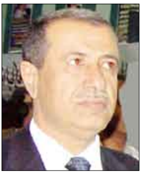
صادق أبو راس

ناقشت اللجنة العليا للمراكز السياحية الصيفية في اجتماعها أمس برئاسة نائب رئيس الوزراء لشئون الداخلية صادق أمين أبو راس الإجراءات الكفيلة بإقامة المخيمات السياحية في عموم محافظات الجمهورية في 13 من الشهر الجاري. وتستهدف فعاليات المخيمات الصيفية التي تبلغ 31 تجمعاً إقامة على الملاعب الرياضية ومركز التدريب المهني والجامعات اليمينية، تأهيل 15 ألفاً و500 شاب وفئاتاً فكرياً وثقافياً بما يتوافق مع وسطية الدين الإسلامي وأهداف فورتي سبتمبر وأكتوبر. بالإضافة إلى اشاعة مفاهيم الاعتدال وتعميق الولاء الوطني لمواجهة الأفكار الضارة التي تدعو إلى التطرف والعلو والعصبية والمذهبية. واستعرض الاجتماع البرنامج العام للمخيمات والذي يتضمن عددا من البرامج الثقافية والرياضية والفنية الكفيلة بتشجيع الإبداع والتنافس بين المشاركين وتنمية معارفهم النظرية والعملية.. فضلا عن إتاحة الفرصة لاكتشاف المواهب والطاقات الإبداعية بهدف إبرازها ورعايتها. وحدد الاجتماع المهام والأنشطة التي يتحتم على قيادات السلطة المحلية في المحافظات القيام بها من توفير للأماكن الهامية والفنية والاشراف والمتابعة الميدانية وحل كافة الإشكالات التي قد تحدث أثناء سير تنفيذ البرامج والأنشطة المقررة من قبل اللجنة العليا. كما أقر الاجتماع المحاضرات والأنشطة الخاصة بالمخيمات.