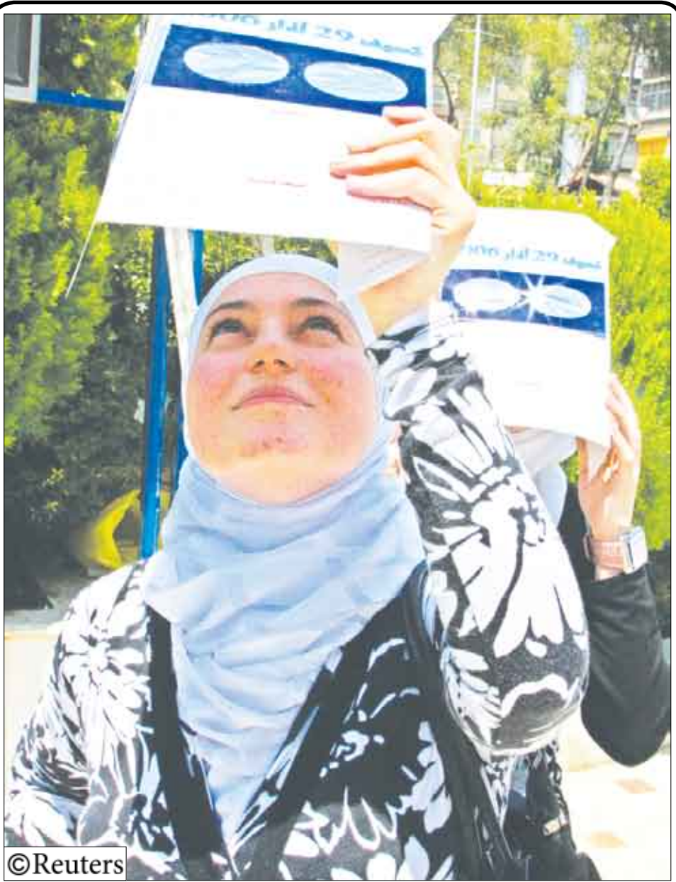
امراة تنظر إلى كسوف الشمس من خلال مرشح خاص للرؤية في دمشق أمس

□ روسيا / غازيتا / مباتيا : تسبب عقب سيجارة في نشوب حريق كاد يقضي على سفينة الأسطول الأمريكي حاملة الطائرات «جورج واشنطن». وكشف التحقيق أن الحريق نجم عن إلقاء أحد أفراد طاقم السفينة الذي كان يخدم في مكان غير مناسب قرب مخزن مواد قابلة للاحتراق، عقب سيجارة. وأوقع الحريق الذي استمر ما يقارب 12 ساعة قبل أن يتم إطفائه، 24 جريحاً بين البحارة وتسبب بأضرار مادية قدرت قيمتها بـ90 مليون دولار. وسرعان ما أعلن سلاح البحرية الأمريكية عن تسريح قبطان السفينة وأحد مساعديه. ولحسن الحظ لم تصل النيران إلى المفاعل النووي (وتعمل سفينة «جورج واشنطن» بالطاقم النووي) ولا شهدت أمريكا وباقي العالم كارثة نووية. وواجهت «جورج واشنطن» الحريق وهي في طريقها إلى قاعدة «يوكوسوكا» في اليابان. ويفترض أن يتم إصلاح الدمار الذي أصاب سفينة الأسطول الأمريكي في قاعدة «سان دياغو».