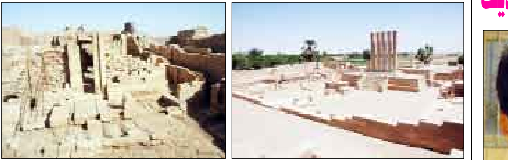
شواهد من مملكة سبأ

حقيقة وجدت في اليمن القديم، وهو ما أكدته آلاف النصوص المنحوتة على الحجر أو المصوية في البرونز التي تم اكتشافها في المواقع الأثرية اليمنية، وكان يطلق على أهل تلك المملكة "السبئيون" وعلى لغتهم "السبئية". وبشير جنسيتهم "كريستيان روبان" عالم الآثار الألماني إلى أن كل اللاتل والشواهد الأثرية تؤكد أن السبئيين اتخذوا من منطقة مأرب عاصمة لملكوتهم "سبأ" وانحصار أراضي سبأ في الأصل بمنطقة مأرب، إلا أن مملكة سبأ توسعت في عهد الملك