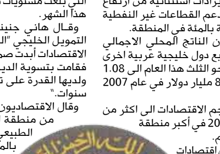
مدينة الشيخ للخدمات الطبية