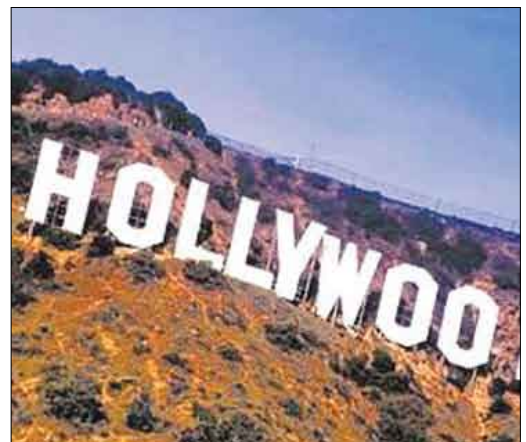
مدينة هوليوود السينمائية

رفضت نقابة للممثلين في هوليوود الفكرة التي طرحه اتحاد كبرى شركات الإنتاج في مدينة السينما الأمريكية بشأن زيادة في الأجور تبلغ 250 مليون دولار تقريبا للأعضاء في النقابة ضمن عقد جديد للأجور مدته ثلاثة أعوام. وهو الأمر الذي يزيد من احتمال مواجهة صناعة السينما لموجة أخرى من الشلل في غضون عام واحد، حسب صحيفة «الوطن» السعودية. وكان اعتراض النقابة بسبب إصرارها على الحصول على زيادة في الأرباح عند استخدام أعمالهم على شبكة الإنترنت ووسائل الإعلام الرقمية الأخرى، كما رفض قادة نقابة ممثلي التلفزيون والسينما «سكربن جيلد أكتوبر» ندوة من اتحاد المنتجين وهو وراطة منتجي السينما والتلفزيون «موشن بيكتشر اند تليفن» لطرخ العرض على تصويت عام من جانب أعضاء النقابة.