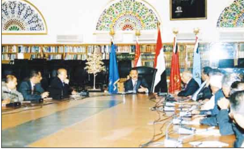
اللجنة العامة للمؤتمر الشعبي العام / (التفاصيل من 3)

مذاع/متابعات: رأس فخامة الأخ الرئيس علي عبدالله صالح رئيس الجمهورية الاجتماع للمؤتمر الشعبي العام أمس الخميس اجتماعاً للجنة العامة للمؤتمر الشعبي العام وفت خلاله أمام العديد من القضايا على الصعيد السياسي والتنظيمي. حيث ناقشت اللجنة العامة مستجدات الأوضاع السياسية وقضايا الحوار مع مختلف الأحزاب والتنظيمات السياسية وبحثت للجنة العامة مجلس النواب على سرعة مناقشة، وإقرار تعديلات قانون الانتخابات وبما يفضي إلى سرعة تشكيل اللجنة العليا للانتخابات. وأكدت اللجنة العامة حرص المؤتمر الشعبي العام على إجراء الانتخابات في مواعيدها الدستورية والقانونية تنفيذاً لالتزاماته والوعود التي تضمنتها برامجه الانتخابية والرئاسية والبرلمانية والمحلية التي منحها الشعب ثقته. كما باركت اللجنة العامة إنشاء التحالف الوطني الديمقراطي بين المؤتمر الشعبي العام وأحزاب المجلس الوطني للمعارضة وحزب الرابطة اليمنية والتنظيم السيمبري، معتبرة أن هذا التحالف إطار سياسي مفتوح لكل الأحزاب والقوى السياسية التي ترغب في الانضمام إليه. كما أقرت اللجنة العامة تعيين الدكتور أحمد عبيد بن دغر - رئيس دائرة المنظمات الجماهيرية - أميناً عاماً مساعدًا للمؤتمر.