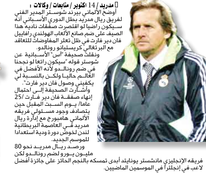
فريقه الإنجليزي مانشستر يونايتد أهدى تمسكه بالنجم الحائز على جائزة أفضل لاعب في إنجلترا في الموسم الماضي.