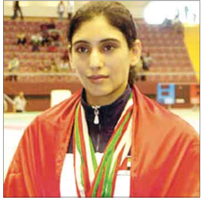
أحدى لاعبات المغرب

الدراجة البيضاء / 14 أكتوبر / منابعات / وكالات :