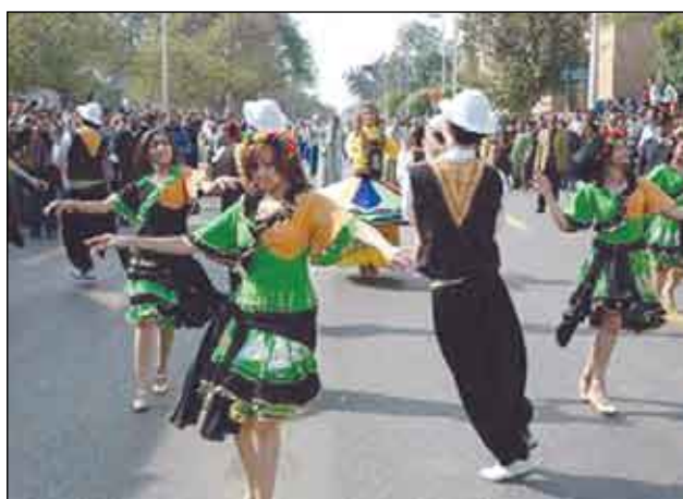
مهرجان الاسماعيلية للفنون الشعبية

الافتتاح والختام على المسرح الروماني بالإسماعيلية. وتابع انه تم وضع شاشات عملاقة في معظم الشوارع والميادين العامة لاتاحة الفرصة لأكبر عدد ممكن من الزائرين لمشاهدة عروض المهرجان. وقال انه ستشارك في مهرجان هذا العام دول استونيا بثلاث فرق وكل من رومانيا وبلغاريا بفرقتين وكل من أرمينيا ومقدونيا وجورجيا وأوكرانيا وروسيا البيضاء وتركيا ولاتفيا والأردن واندونيسيا واسبانيا وبولندا والجزائر وفلسطين بفرقة واحدة فقط فيما ستشارك مصر بست فرق هي فرق الزهور والطريق الدائري والملاحه والإسراع والجلاء وفابند ودار الاوبرا والقاهرة اضافة الى اقامة حفلاتي الشعبي.