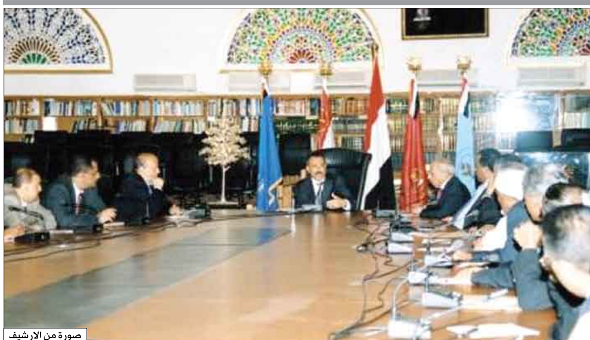
صورة من الارشيف

دعوة الأحزاب والتنظيمات والمنظمات المدنية إلى الوقوف صفاً واحداً ضد التطرف بكافة أشكاله