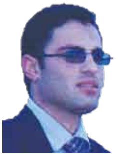
الشاعر المصري / أحمد السرساوي