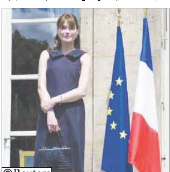
كارلا بروني سيدة فرنسا الأولى في قصر الإليزيه بباريس

باريس/14 أكتوبر/ رويترز: وزعت السيدة الفرنسية الأولى كارلا بروني ساركوزي نسخة من ألبوم أغانيتها الجديد على أعضاء الحكومة الفرنسية مع بدء العطلة السنوية المعتادة للوزراء. ووصلت زوجة الرئيس الفرنسي نيكولا ساركوزي عارضة الأزياء السابقة حامله نسخاً على استوائيات مدمجة (سي دي) ألبومها "وكان شيئاً لم يكن" حين اجتمع الوزراء لشرب نخب اجتماعهم الأخير قبل بدء العطلة الممتدة 21 أغسطس المقبل. وقالت نادين مورانو وزيرة الدولة للشؤون الأسرة "لقد ابتغته الألبوم بالفعل لكنني أفكر لفئة الصداقة هذه". كما بدأ وزير الميزانية إريك ويرت سعيداً وهو يغادر الاجتماع حامله هديته في يده وقال "اعتقد انه رائع سأستمع اليه في هذو خلال العطلة". وصدر الألبوم في 11 يوليو حاملاً اسمها قبل زواجها من الرئيس كارلا بروني وتصدر قائمة أفضل مبيعات في الأسبوع الأول لطرحة في الأسواق. وكانت بروني قد أصدرت من قبل ألبومين غنائيين لكن هذا هو ألبومها الأول بعد قصتها الغرامية المخلطة مع الرئيس الفرنسي الذي تزوجته في فبراير الماضي بعد أقل من ثلاثة أشهر من لقاءهما. والتارت بعض أغاني الألبوم دمسحة الصحافة الفرنسية. وتقول السيدة الفرنسية الأولى في إحدى أغانيها "أنت محبدي... أشد فتكا من الآخرون الأغفاني وأخطر من الكوكابين الكولومبي". وأحدثت هذه الأغنية خلافاً دبلوماسياً بين فرنسا وكولومبيا.