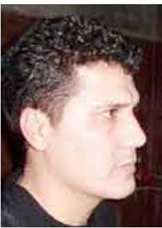
الشاعر والقاص الليبي / محمد زيدان