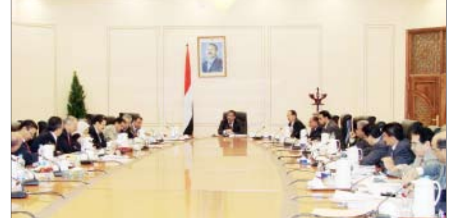
صنعاء / متابعيات: عقدت اللجنة الوزارية العليا المشتركة لمعالجة الآثار والتداعيات الناتجة عن أحداث الفتنة في محافظة صعده اجتماعها الخامس أمس برئاسة الدكتور علي محمد مجور رئيس مجلس الوزراء.

عقدت اللجنة الوزارية العليا المشتركة لمعالجة الآثار والتداعيات الناتجة عن أحداث الفتنة في محافظة صعده اجتماعها الخامس أمس برئاسة الدكتور علي محمد مجور رئيس مجلس الوزراء. كرس الاجتماع لمراجعة وتقييم الوضع الراهن والأنشطة والمشاريع الحكومية بمحافظة صعده، وكذا مستوى تنفيذ المشاريع الخدمية والتنموية المعتمدة للمحافظة في البرنامج الاستراتيجي والموازنة العامة للدولة للعام الجاري 2008م. وأقرت اللجنة تكليف جميع الوزارات الخدمية باتخاذ الإجراءات السريعة لمباشرة الإجراءات التنفيذية للمشاريع المعتمدة في موازنة العام الجاري خلال أسبوعين، ورفع التقارير اللازمة بالإجراءات المنهذة والمتطلبات والاحتياجات الضرورية للتنشغيل خلال عشرة أيام.