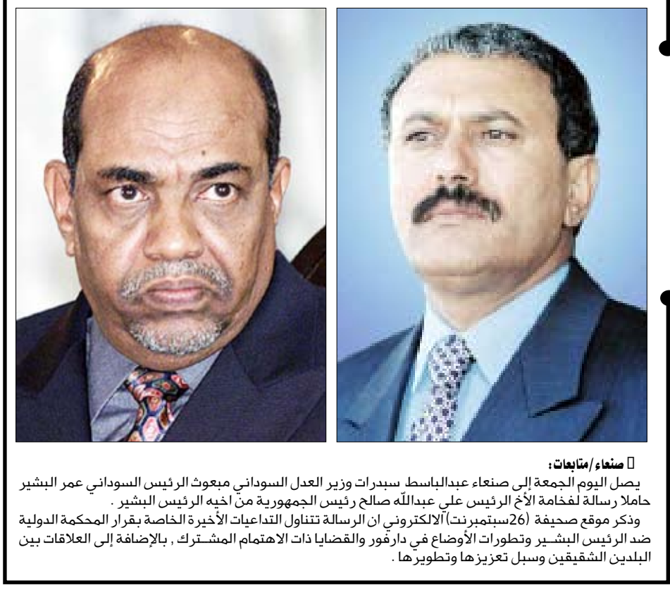
صنعاء / متابعيات: يصل اليوم الجمعة إلى صنعاء عبدالباسط سبدرات وزير العدل السوداني بمبعوث الرئيس السوداني عمر البشير حاملاً رسالة لفخامة الأخ الرئيس علي عبدالله صالح رئيس الجمهورية من أخيه الرئيس البشير.

16 صفحة | الجمعة 25 يوليو 2008م | الموافق 22 رجب 1429 هـ | العدد 14185 | السنة الأربعة | السعر 20 ريالاً مواقيت الصلاة: الفجر 4:25 | الشروق 5:44 | الظهر 12:08 | العصر 3:25 | المغرب 6:28 | العشاء 7:35 حسب التوقيت المحلي لمدينة عدن