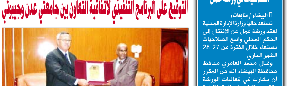
عدن / 14 أكتوبر / عبدالرحمن محسن عبدالرحمن: تم صباح أمس في ديوان رئاسة جامعة عدن التوقيع على البرنامج التنفيذي لاتفاقية التعاون العلمي والثقافي بين جامعتي عدن وجيبوتي وقعا عن جانب جامعة عدن. د. عبدالعزیز صالح خنجر رئيس الجامعة - وعن الجانب الجيبوتي الدكتور فهمي أحمد محمد رئيس جامعة جيبوتي.

وخلال جلسة المباحثات بين الطرفين أشاد د. بن خنجر بالعلاقة الحميمة بين الجامعتين وسبل الارتقاء بها دعما للعلاقات الأخوية التاريخية بين الشعبين المحافظين وأمانه العموم ومدراء المحافظين ومندوبي الجامعة جيبوتي الفتيعة تنفيذًا لتوجهات القيادة السياسية، كما تم خلال اللقاء بحث سبل