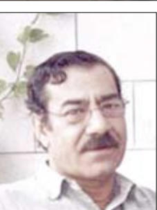
الشاعر وناقد السوري / فيصل قرقطي