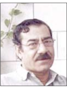
الشاعر والناقد السوري / فيصل قرقطي