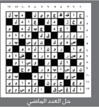
حل العدد الماضي

أفقياً : 1- أحد أبطال حرب البسوس وقاتل كليب بن ربيعة - بيت الدجاج. 2- ديانة وضعية يبلغ عدد معتنقيها 18 مليون رجاء. 3- مدخل - حرف أبجدي - نصر. 4- من الفواكه - بلد عربي. 5- من أشهر المدن الأمريكية - للتعريف. 6- صوت اليوم - حرف جر - مدينة فرنسية. 7- أحرف متشابهة. 8- عملة - رقود - بط. 9- للاستفهام - عاصمة آسيوية. 10- اسم علم مؤنث - شركة عالمية لإنتاج المشروبات الغازية. 11- جمع جبل - نقيض أحياء. 12- هواء عليل - مصباح. عمودياً : 1- من أشهر علماء العرب. 2- أمن - شهر سرياني. 3- البلد المستضيف لكأس العالم للعام 1982م - من الزهور العطرية. 4- حرف انجليزي - بلد آسيوي - أحرف