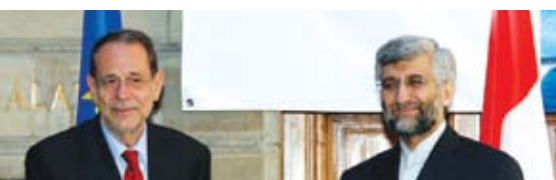
سعيد جليلي صافح أمس خافيير سولانا منسق السياسة الخارجية في الاتحاد الأوروبي أثناء توجههما إلى الجلسة الأولى من المحادثات

الاجتماع النووي للتحسين في طهران «اجتماع اليوم (أمس) عقد في بسمتر وتهدف إلى المشاركة في اجتماعات أخرى حتى تخرج وجهات النظر كل الأطراف على المائدة لكي نتوصل... لاتفاق.» ولم يوضح متكي ماذا يعني باتفاق لكنه اضاف انه يأمل أن تمهد محادثات جنيف الطريق أمام الاتفاق على «شكل واطار» لمزيد من المفاوضات.