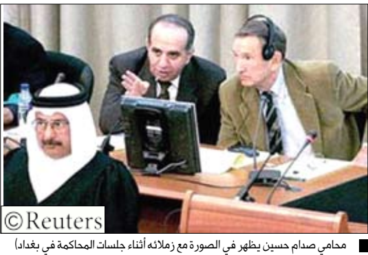
محامي صدام حسين يظهر في الصورة مع زملائه أثناء جلسات المحاكمة في بغداد