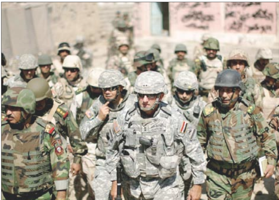
قوة مشتركة من الجنود الأمريكيين والعراقيين في إحدى العمليات العسكرية الموجهة ضد تنظيم القاعدة

وقال سليم الجبوري وهو مشرع كبير بجبهة التوافق بعد التصويت في البرلمان إن مجلس النواب (البرلمان) العراقي صوت يوم أمس لصالح عودة وزراء الجبهة إلى الحكومة لتنهي بذلك الجبهة ما يقرب سنة من المقاطعة للحكومة التي يرأسها رئيس الوزراء الشيوعي نوري المالكي. ووصف الجبوري عودة جبهة التوافق إلى الحكومة بأنها «خطوة حقيقية في الإصلاح السياسي»، وأجرى البرلمان نقاشا مع المرشحين لشغل عشرة مناصب شاغرة في الحكومة من بينها رئيس حقايق وزارية إضافة إلى منصب نائب وزير القوات التي كانت مخصصة في السابق لجبهة التوافق.