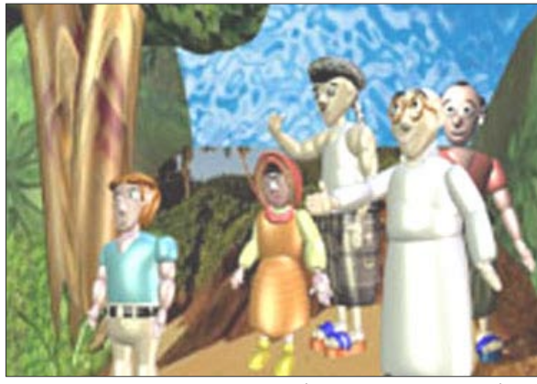
أفلام ترفيهية وتعليمية للأطفال