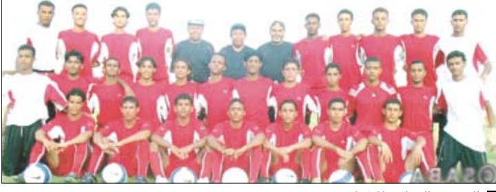
المنتخب الوطني للشباب

مرحلة إيجابية من الاستعداد في معسكره الداخلي بمدينة عدن تضمن العديد من المراحل التأهيلية للاعبين المنتخب استعداداً لخوض المباريات التجريبية في معسكر تركيا. وتضمن تشكيلة منتخب الشباب لكرة القدم الحالية 28 لاعبا فيما سيستمر المعسكر لمدة 20 يوما يتخلله إقامة أربع مباريات تدريبية مع عدد من فرق الشباب التركية. وقال الغراني أن هناك فرصة كبيرة للنجاح للمنتخب خلال المنافسات النهائية لكأس آسيا مع الدعم الكبير الذي يلقاه من وزارة الشباب والرياضة والاتحاد العام لكرة القدم في تهيئة الظروف المناسبة بغية تحقيق انجاز جديد لكرة القدم.