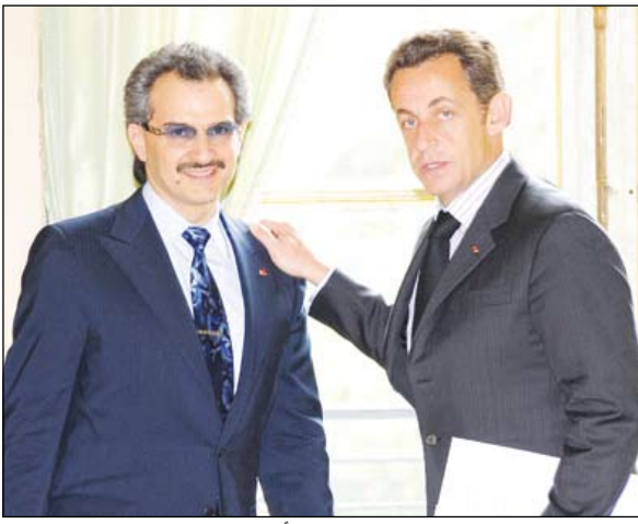
الرئيس ساركوزي خلال استقباله للأمير الوليد

وتطرق فخامة الرئيس وسموه إلى الحفل الرسمي الذي سيقام في باريس بوضع حجر الأساس لقسم الفنون الإسلامية بمتحف اللوفر، وفي نهاية اللقاء، توجه كل من فخامة الرئيس ساركوزي وسمو الأمير الوليد سويا في سيارة الرئاسة الفرنسية إلى متحف اللوفر لوضع حجر الأساس لقسم الفنون الإسلامية.