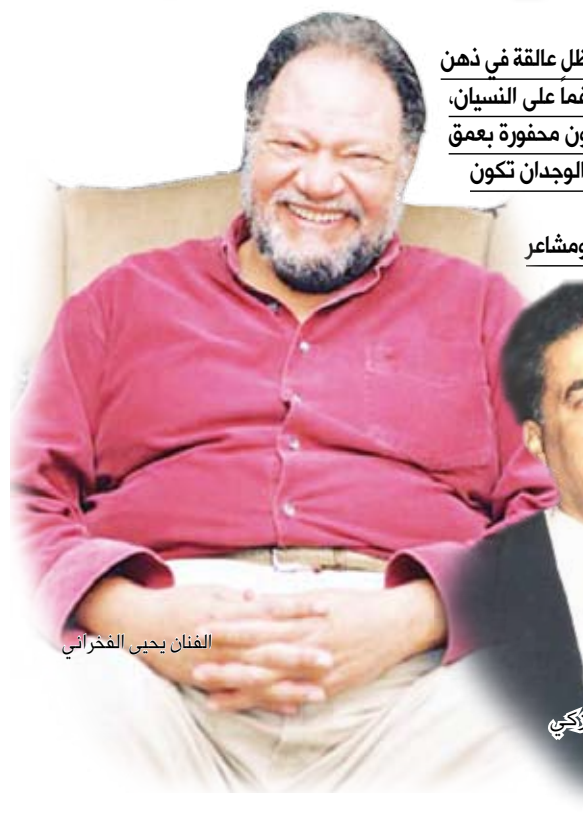
الفنان يحيى الفخراني

وفي ذاكرة الفنانين مثل هذه الأحداث والتي عندما نستدعيها فإنها تلقي الضوء على وجدان ومشاعر وعواطف الفنانين تجاه الحياة والمجتمع والفن.. ليس من خلال ما يقولونه من آراء وأفكار يكون قد أعادوا لها من قبل، ولكن من خلال ما تشي به هذه الأشياء التي ما زالت في ذاكرتهم من إعلاء للحب والزواج أو للنجاح والشوق أو القيمة والتفوق.