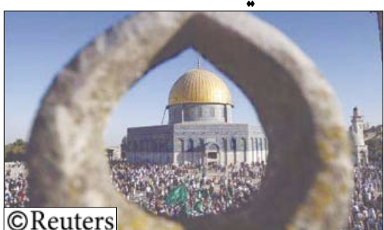
اطفال مسلمون يتجمعون عند قبة الصخرة في مجمع المسجد الأقصى بالقدس الشرقية

مهرجان (القدس 2008 للموسيقى العربية) يفتل في استضافة فرق عربية