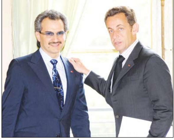
الرئيس ساركوزي خلال استقباله للأمير الوليد

وتطرق فخامة الرئيس وسموه إلى الحفل الرسمي الذي سيقام في باريس بوضع حجر الأساس لقسم الفنون الإسلامية بمتحف اللوفر. وفي نهاية اللقاء، توجه كل من فخامة الرئيس ساركوزي وسموه الأمير الوليد سويًا في سيارة الرئاسة الفرنسية إلى متحف اللوفر لوضع حجر الأساس لقسم الفنون الإسلامية. مع العلم بأنه قد تم منح الأمير الوليد مطلع عام 2006م وسام الشرف الفرنسي برتبة قائد "Legion of Honor" في حفل رسمي رفيع بقصر الإليزيه Blysee Palace بالعاصمة الفرنسية باريس. وقد قلد فخامة الرئيس الفرنسي السابق جاك شيراك سمو الأمير بالوسام الذي يعد أعلى وسام يمنح من دولة فرنسا، والذي منح لسموه تقديرًا لمساهماته في توثيق العلاقات السعودية-الفرنسية في الاقتصاد وإدارة الأعمال والثقافة. وفي عام 2007، منح سموه وسام الراعي الرئيسي للفنون، من سعادة وزيرة الثقافة والاتصال الفرنسية السيدة كريستين الباتلين.