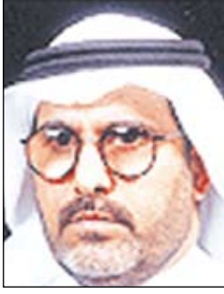
د. محمد بن عبدالله اللهيان

أكبر وأشمل تتفق خلفه حكومتنا الرشيدة بقيادة خادم الحرمين الشريفين الملك عبدالله بن عبدالعزيز وولي عهده الأمين صاحب السمو الملكي الأمير سلطان بن عبدالعزيز وبمتابعة مباشرة من رجل الدبلوماسية الأول صاحب السمو الملكي الأمير نايف بن عبدالعزيز وزير الداخلية - فلفهم الله - مؤازرين بتكاتف الشعب وتأييده اللامحدود لحزم وعزم الدولة في اجتثاث الإرهاب من جذوره مستعينين بالله وبالرجال الأكفاء والتدريب المتفوق وشمولية المواجهة حيث تشمل الحياة التي تعزز الإرهاب وتقويه والتي تشمل بدورها المخطط والممول والمشجع والمؤيد والمتعاطف والمستفيد على قتلهم. إن كشف سر الإرهاب وأهدافه هو الضمانة الرئيسية لمنع الانحراف فيه.. كما أن كشف القوى التي تتف خلفه من الداخل أو الخارج من أقوى القرائن التي تعزز الشفافية والمصداقية وهي البيئة التي تكثفها الإرهابيون. نعم إن نكركا جميع أبناء الشعب مع الدولة كفيل بهزيمة الإرهاب ويدخل ضمن ذلك التربية الصالحة والمتابعة الدقيقة لحراك الأبناء وتصرفاتهم ومعرفة توجهات أقرانهم وأصدقائهم ناهيك عن عدم ترك الحبل على الغارب.. إن التنسيب والالتكالية والإفراط بالثقة والحاجة والفراغ من أهم السبل التي يستغلها قراصنة العصر ومجرموه للإيقاع بالشباب في برائت المخدرات والسرفة والإهراب وغيرها من المنحدرات التي أصبحنا ندمع عنها والتي ربما تشكل عدة أوجه لعملة واحدة أساسها هدم المنجزات والقضاء على زهرة هذا الوطن من الشباب الذي يجب أن يلتفت إليه إعلاميًا وتعليميًا وأن يتوقف بالأخبار التي تستهدفه أو تستخدمه وسيلة لتحقيق أهداف أخرى. إن إجهاض مخططات الإرهاب قبل وقوعها دليل مادي وعملي على أن ظاهرة الإرهاب إلى زوال أو نجمه إلى أفول.. والله المستعان..