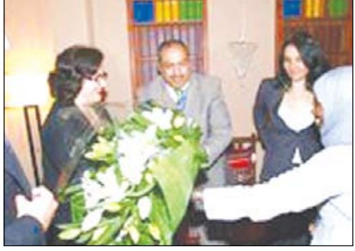
وزيرة الثقافة الأردنية تزور الجناح الكويتي

كوبا / كونا : قامت وزيرة الثقافة الأردنية نانسي بكير بزيارة جناح دولة الكويت في معرض اكسبو 2008 في مدينة سرقسطة الاسبانية. وابلغ مدير إدارة إعلام الدول الأجنبية بوزارة الإعلام عبدالله زيد الخالدي وكالة الأنباء الكويتية (كونا) أن وكيل وزارة الإعلام المساعد للشؤون الإدارية والمالية ونائب رئيس اللجنة التحضيرية للجناح إبراهيم النوح في استقبال الوزيرة الأردنية والوفد المرافق لها. وقال الخالدي إن الوزيرة بكير جالت في أنحاء المعرض حيث تم شرح أجزاءها لها كما شاهدت العرض السينمائي المميز في قاعة (قطرة الماء). وذكر أن الوزيرة سجلت كلمة في سجل شرف الزائرين ضمنتها بجزيل شكرها للكويت قيادة وحكومة وشعبًا متمنية النجاح والتوفيق للجميع كما أعربت عن سعادتها بزيارة الجناح الذي وصفته بالرابع والمميز كشعب الكويت. وأضاف أنها قدمت شكرها لأعضاء الوفد الكويتي المشارك في الجناح وذلك على استقبالهم كما أعربت عن إعجابها بالجناح حيث عدته من أفضل الأجنحة المشاركة بالمعرض.