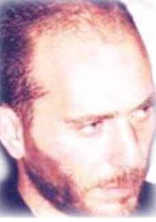
الشاعر السوري / هاني يحيى