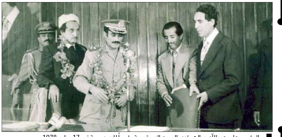
الرئيس علي عبدالله صالح يؤدي اليمين الدستورية رئيساً للجمهورية في 17 يوليو 1978م

مواقيت الصلاة: | الفجر 4:22 | الشروق 5:42 | الظهر 12:08 | العصر 3:28 | المغرب 6:29 | العشاء 7:37 حسب التوقيت المحلي لمدينة عدن