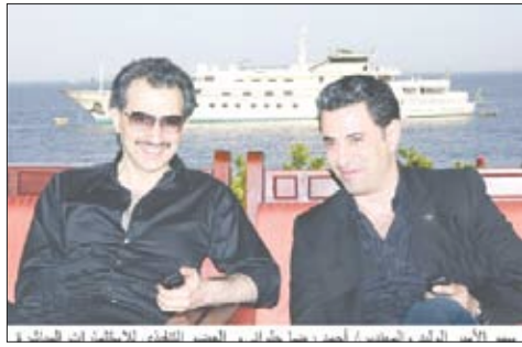
سمو الأمير الوليد والمهندس أحمد رضاحلواني

L.P. حيث ان نسبة ملكية شركة المملكة 75٪، وتهدف بشكل اساسي إلى التركيز على الفرص المتاحة في المنطقة والشركات العاملة في أفريقيا. وستدير (كارام) الصندوق الجديد (PAIP II). والجدير بالذكر أن الصندوق الأول (PAIP I) استثمر أكثر من 100 مليون دولار أمريكي في الأسهم الخاصة للعائدة لقطاع الاتصالات، والخدمات المالية، وتقنية المعلومات، والتعدين، وقطاعات التجزئة، والمنتجات والخدمات التجارية. كما يركز الصندوق على الإستثمار في الشركات المتعددة الجنسيات ذات القدرة السليمة على النمو والمهارة الموثوقة للمنافسة على المستويين المحلي والإقليمي.