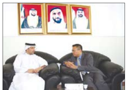
مؤسسة خليفة الخيرية تستعرض مشاريعها الخيرية والإنسانية