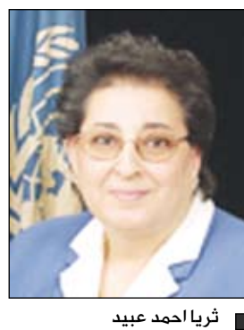
■ ثريا أحمد عبيد

اليوم ونحن نحتفل في اليوم العالمي للسكان، دعونا نجدد التزامنا للحفاظ على كرامة الإنسانية وعلى حق في العيش المتحرر من كل خوف وعوز، دعونا نسرع الجهود لتحقيق الأهداف الإنمائية للألفية للقضاء على الفقر المدقع والجوع وتحسين صحة الناس وكوكبنا. علينا مضاعفة الجهود لتمكين المرأة وتأمين الحصول الشامل على خدمات الصحة الإنجابية بحلول العام 2015 أن خدمات الصحة الإنجابية تحافظ على صحة الأمهات وأطفالهن.