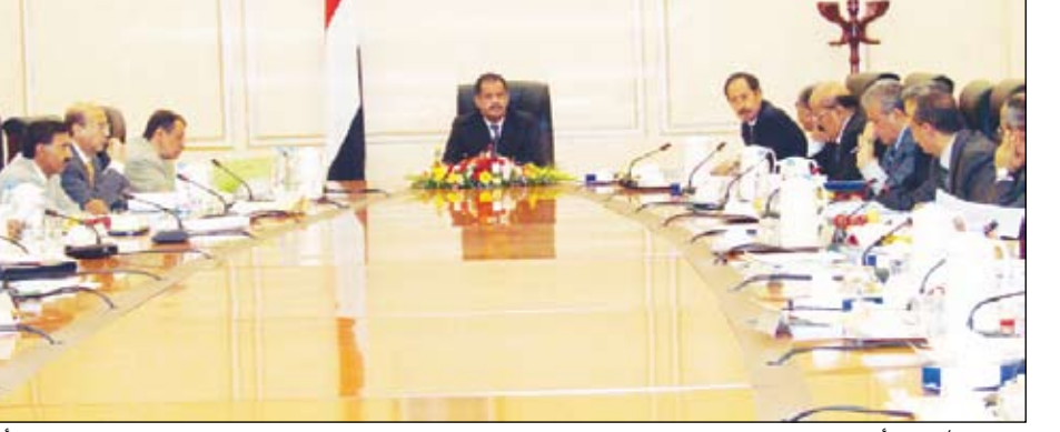
المواني / المنشأة في المنطقة الحرة

بعدن بالشراكة بين مؤسسة مواني خليج عدن اليمنية وشركة مواني دبي العالمية اليمنية المحدودة التابعة لمواني دبي العالمية بنسبة مشاركة 50 بالمائة لكل طرف.