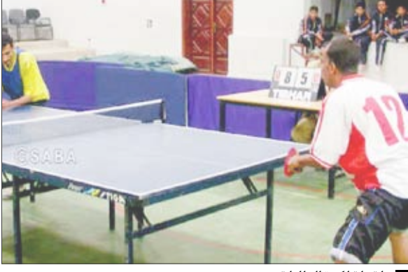
لقطة لكرة الطاولة

المجموعة الرابعة : أبين - المحويت - 3/صفر