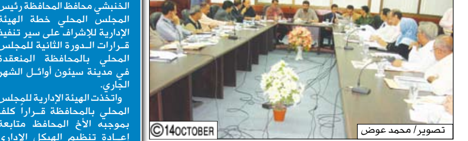
عدين / وادع تهيبي:

ناقش المكتب التنفيذي لمحافظة عدن في اجتماعه الدوري أمس برئاسة المحافظ عدنان عمر الجفري تقريراً عن مستوى تنفيذ موازنة القوى الوظيفية في بعض وحدات السلطة المحلية بالمحافظة للعام المنصرم 2007م بالإضافة إلى تقرير عن نشاط مكتب الأشغال العامة والطرق للفترة (يونيو - ديسمبر عام 2007م).