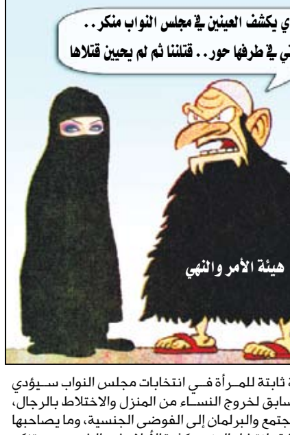
هيئة الأمر والنهي

وسط غياب لافت للنظر من ممثلي الدولة والحكومة، وبعيداً عن مشاركة وحضور ممثل عن وزارة الشؤون الاجتماعية، وهي الجهة المعنية بإشهار الشريعة القانونية للمؤسسات والمنظمات غير الحكومية، عقد عدد من رجال الدين الحزبيين ملتقى لإعلان تأسيس ما تسمى (هيئة الأمر بالمعروف والنهي عن المنكر) التي قوبلت برفض واسع من قبل الأوساط الحزبية والسياسية والثقافية والإعلامية في المجتمع وفي مقدمتها صحافة الحزب الحاكم، وأحزاب (اللقاء المشترك) والصحف الرسمية والحزبية والأهلية، الأمر الذي أضفى على هذه المواجهة طابعاً وطنياً تجسدت فيه وحدة الصالح والأهداف الوطنية المشتركة للقوى السياسية والنخب المثقفة في السلطة والمعارضة على حد سواء. وفي أول فعالية لما تسمى (هيئة الأمر بالمعروف والنهي عن المنكر) التي عقدت لملتقى مؤسسها في قاعة (أبو لولو) بالعاصمة صنعاء يوم أمس الثلاثاء، أصدر مؤسسو هذه الهيئة غير الشرعية كتيباً دعا فيه رجال الدين الحزبيين في (التجمع اليمني للإصلاح) الذين يتصدرون قيادة ما تسمى هيئة (الأمر والنهي) إلى ضرورة التصدي الحازم لمشروع (الكوتا النسائية) الذي ورد في إطار المبادرة الرئاسية بشأن التعديلات الدستورية التي تضمنها البرنامج الانتخابي لفخامة رئيس الجمهورية، وبضمنها زيادة عدد مقاعد النساء في مجلس النواب وتحديد نسبة 15 ٪ كمقاعد ثابتة للنساء في البرلمان. ووصف مؤسسو ما تسمى هيئة (الأمر والنهي) مشروع (الكوتا النسائية) بأنه يعد من أكبر المنكرات التي يجب التصدي لها، لأن