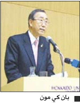
■ بان كي مون

وخاتماً نلاحظ جميع زملاني الطلاب الطالبات بالتوجه إلى المراكز الصيفية في أمانة العاصمة والمحافظات وأحد أولياء الأمور على تشجيع أبنائهم وبناتهم للاتحاق بالمراكز الصيفية لتعود عليهم بالنفع والفائدة.