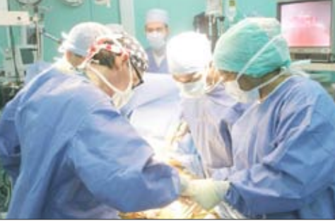
زايد العطاء تطلق أول برنامج لجراحة القلب بالمنظير

وأكد أن رعاية سمو الشيخ حمدان بن زايد آل نهيان نائب رئيس مجلس الوزراء رئيس هيئة الهلال الأحمر ودعمه المستمر للمجموعة الإماراتية العالمية للقلب كان له الأثر الكبير للوصول بالمبادرة إلى العالمية. ..مكنتها من تحقيق العديد من الإنجازات " وكندا " 50 " وقد حرصت اللجنة المنظمة على تنظيم الملتقى لتكون المبادرة الأولى من نوعها في المنطقة تنظم بشكل دوري ومستمر وتجذب الخبراء من التخصصات النادرة في جراحات القلب المفتوح وسيجري مهاراتهم وإمكاناتهم لتقديم أفضل الخدمات العلاجية والجراحية