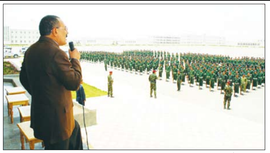
صنعاء / سبأ:

قال فخامة الرئيس علي عبد الله صالح رئيس الجمهورية: إن دعاة الإمامة المتخلفة ودعاة المناطقية وجهان لعملة واحدة وهم جميعاً عناصر مستأجرة تسعى إلى لإضرار باليمن تنفيذاً لأمر وأهداف من يستأجرهم للقيام بذلك وعلى حساب الدم اليمني واستقرار ومصالح اليمن. وقال فخامة الرئيس خلال زيارته أمس لمركز التدريب العام للشرطة بمحافظة ذمار: إن وطننا قد انتهى نهج الحرية والديمقراطية وهو يواصل خطاه الواثقة على هذا الدرب ولن يجيد عنه. وأكد في حديثه إلى الضباط والجنود من منتسبي مركز التدريب العام للشرطة بمحافظة ذمار أنه لن يسمح باستغلال الديمقراطية للهدم والتخريب أو الانقضاض على مبادئ الثورة أو النظام الجمهوري أو الوحدة وهي ثوابت وطنية مصانة بالدستور ويوعي الشعب وتضحيات وعطاءات قواته المسلحة والأمن. وأضاف: إن تضحيات وعطاءات أفراد القوات المسلحة والأمن هي مركز الأمن والاستقرار، مشيراً إلى أن الأمن والاستقرار هما الأساس للتنمية ولا تنمية دون أمن واستقرار.