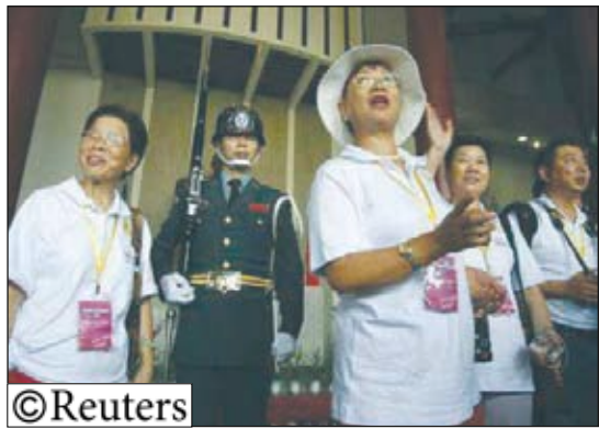
صينيون يقومون بجولة سياحية في العاصمة التايوانية تايبيه

السائحون الصينيون ينفقون 1.3 مليون دولار في تايوان