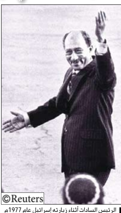
الرئيس السادات أثناء زيارته لإسرائيل عام 1977م

ويشير البيان إلى قدرة الحكومة الإيرانية على منع إنتاج الأعمال الفنية التي لا تتفق مع وجهة نظرها. وفي الأسبوع الماضي استدعت وزارة الخارجية المصرية رئيس بعثة زيارته في القاهرة السيد حسين رجبى وأبلغته بأن الفيلم الذي يستغرق عرضه حوالي ساعة واحدة للعلاقات اليلدين. ووجهت صفح مصرية انتقادات حادة للفيلم الذي قالت إحداه أنه يصمم السادات بالخاطبة لتوقيع معاهدة للسلام مع إسرائيل عام 1979 ويشيد بالإسلامبولي.