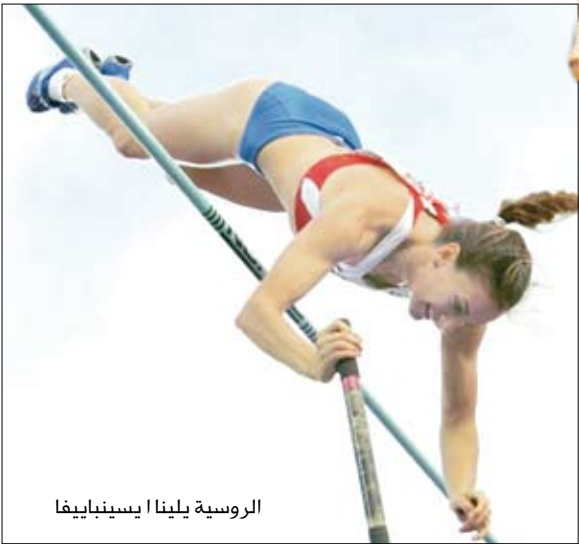
الروسية يلينا إيسينباييفا

وهي المرة 22 التي تنجح فيها إيسينباييفا (26 عاماً) بطلاة أولمبياد أثينا، في تحطيم الرقم القياسي العالمي للمسابقة سواء في الهواء الطلق أو داخل قاعة حيث يبلغ رقمها القياسي العالمي 4.95 م وسجلته في دونينسك في 16 شباط/فبراير الماضي.