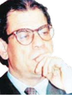
الشاعر والناقد المصري / حلمي سالم