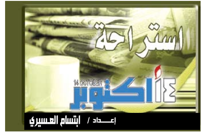
إعداد / إبنسام العسيري

المفاصل ومشكلات قلبية. ولا يتوافر اي علاج لهذا المرض الى يومنا هذا فيما لا يزال معدل الحياة محدوداً جداً لدى هؤلاء المرضى (12 او 13 سنة وسطياً). وقام فريقاً نيكولا ليفي وكارلوس لوبيز اوتين (كلية الطب في جامعة اوفيدوا) بتجربة على فئران لعلاج يرتكز الى مزيج بين جزئيتين موجودتين، تستخدم احدهما لخفض نسبة الكوليسترول في الدم وللوقاية من مخاطر الإصابة بأمراض قلبية، والآخرى لمعالجة ترقق العظام. وتنجم الشيخوخة المبكرة عن تراكم بروتين متور هو البروجرين في الخلايا. وفي خلايا المرضى (في المختبر) ثم لدى الفئران، أكد الباحثون ان مزج هاتين الجزئيتين ساعد على محاربة سمية هذه البروتينة غير الطبيعية وادي الى تخفيف تطور المرض وابطائه. فالعلاج خفف من اعراض المرض مثل تأخر النمو ونقص الوزن وتساقط الشعر وهشاشة العظام، وزاد من معدل الحياة لدى الفئران (179 يوماً مقابل 101 يوماً كمعدل وسطي). ومن المتوقع ان تستمر التجربة السريرية على الاطفال ثلاث سنوات.