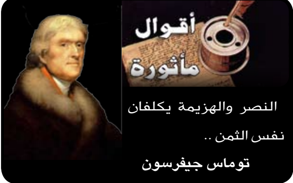
النصر والهزيمة يكلفان نفس الثمن ..

قدوما من مدينة قاس نحو مدينة مراکش، تتراصف سلسلة من الجبال يغابت شجرة الأرز على طول الطريق، وتتمثل القرود بمنطقة أزرو وإفران هذا المنظر الرابع من قبهم العالمية. إنه من الغريب أن لاتخطى هذه المنطقة باهتمام كبير من قبل محبي الجولات إذ أنهم يفضلون عليها منحدرات جبل أوكيمند وجبال الأطلس الكبير حيث يتساقون إلى قمة جبل طوبقال. يعتبر الأطلس المتوسط مركزا لصيادة أفضل سمك التروتة في إفريقيا، منذ أن بدأ فصل الصيد في شهر مارس، يستعد الصيادون المغاربة والأجانب ومعهم تصريح صيدهم لينطلقوا في الصباح الباكر حتى يكون الصيد غزيرا. إذا كنتم في منطقة أزرو وإفران، يمكنكم أن تحصلوا على تصريح الصيد ليلة انطلاقكم، فمن التصريح مايقارب 100 درهم يغي 10 أورو. استرشدوا من فندقكم، أو المركز السياحي المحلي أو ذهبوا إلى العمالة لتحضير سفركم. على التصريح أن يكون دائما معكم لتدلوا به لمرابي الصيد المحليين. أما فصل الشتاء في الأطلس المتوسط فيمكن أن يكون قاسيا مثل شتاء الأطلس الكبير، تتمتع الغابات والحضائر في المرتفعات السفلى بخصوبة كبيرة وذلك بفضل غزارة الأمطار والثلج التي تتساقط في المنطقة منذ شهر نوفمبر إلى شهر أبريل. إذا كنتم في زيارة للمنطقة خلال فترة ما بين شهر ديسمبر ومارس لا تنسوا أن تحضروا أحذية الثلج وكذا