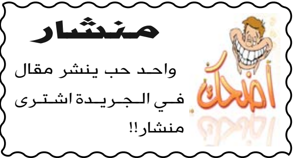
واحد حب ينشر مقال في الجريدة اشترى منشار !!