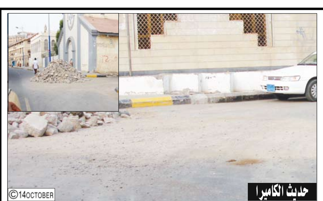
حادثة الكاميرا تصوير وتعليق / علي الدراب؛ هناك كثير من الطرق والشوارع التي يجري تحسينها وإعادة سفلتها، لكن وبمجرد انتهاء تلك الأعمال تبقى المخلفات من أكوام الحجارة والأتربة عند مداخل تلك الطرقات والشوارع ولا يتم رفعها في حينه ما يسبب عرقلة لحركة السير ومضايقة لمستخدمي الطريق.