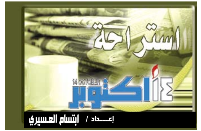
إعداد / إنشام العسيري

واشنطن / متابعة: أفادت دراسة أجرتها جامعة ميشيغن اينستيتوت فور سوشل ريسيرتش في حوالى خمسين دولة بين 1981 و2006 ان السعادة تحرز تقدما في العالم. وقالت الدراسة التي نشرتها مجلة (يرسيكتيفز أوف سايكولوجيكال ساينس) في عدد تموز/يوليو ان الشعور بالسعادة سجل تقدما في اربعين بلدا من 52 تناولتها الدراسة. والدنامرك في على رأس اللائحة بينما زيمبابوي هي في اسفل الترتيب ، وجاء في الدراسة التي تحمل عنوان وورد فالويوز سورفيز دراسة حول قيم العالم ان الناس في الهند وايرلندا والمكسيك وبورتوريكو وكوريا الجنوبية اكثر سعادة في 2006 مما كانوا عليه في 1981 . واضافت ان الشعور بالسعادة يتقدم ببطء اكثر في 14 دولة اخرى