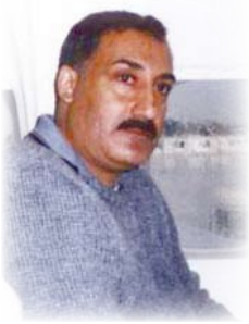
الشاعر العراقي/ حسين الهاشمي