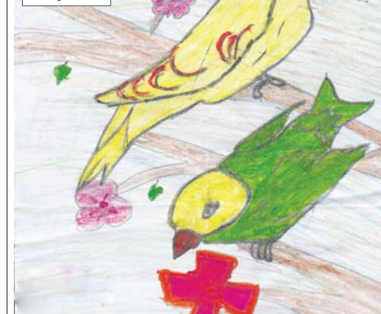
أمو يا ملكة قلبين تحب الرسم ويحبك النور تحبني الزهور وصحبة الملمر