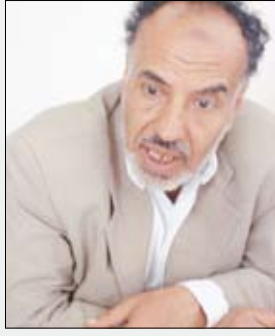
أمين الدار المحففي