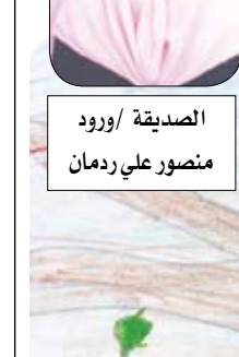
الصديقة / وروود منصور علي رمضان