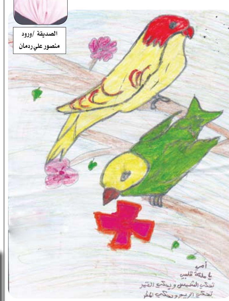
الصدیقة / وروود منصور علي زهران