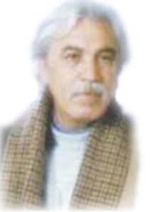
الشاعر الفلسطيني خالد أبو خالد

لشقات خيل الداهبين إلى غبار الماء... كي يأتوا بمعجزة.. تلامح ليهم.. والليل فحم في الميطرات القريبة.. والبعيدة.. مأمم.. فحم على قبر الكلام.. الليل فحم في العظام.. الليل أريفة الحداد على النفاية.. والركام الليل من ثمر حرام.. والليل فحاش المحابر.. والهواء.. الليل مشتبك.. وذئب في الصقيع.. وصوته يعوي يلاحقنا إلى جسد الربيع.. مري إلي على المواعيد القديمة.. والسؤال مري على سغب الليالي.. وافردني شالين من قصب علينا.. ردي إلي ربايتي كما أغني مرة أخرى أغانيها وأهدبها إلينا..