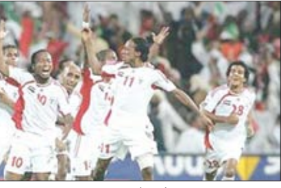
بحسب مسؤول رياضي بحريني

كأس العالم 2010 بجنوب إفريقيا مؤكداً أن قرار التأجيل النهائي سيكون بيد الأمانة العامة للشباب والرياضة لدول الخليج العربي. وأشار إلى أن اللجنة العليا المنظمة للبطولة بعمان ستتكمّل بكل الأمور المتعلقة بقرار التقديم.