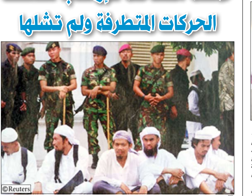
من عمليات احتجاز الممتددين التي تمت مؤخرا