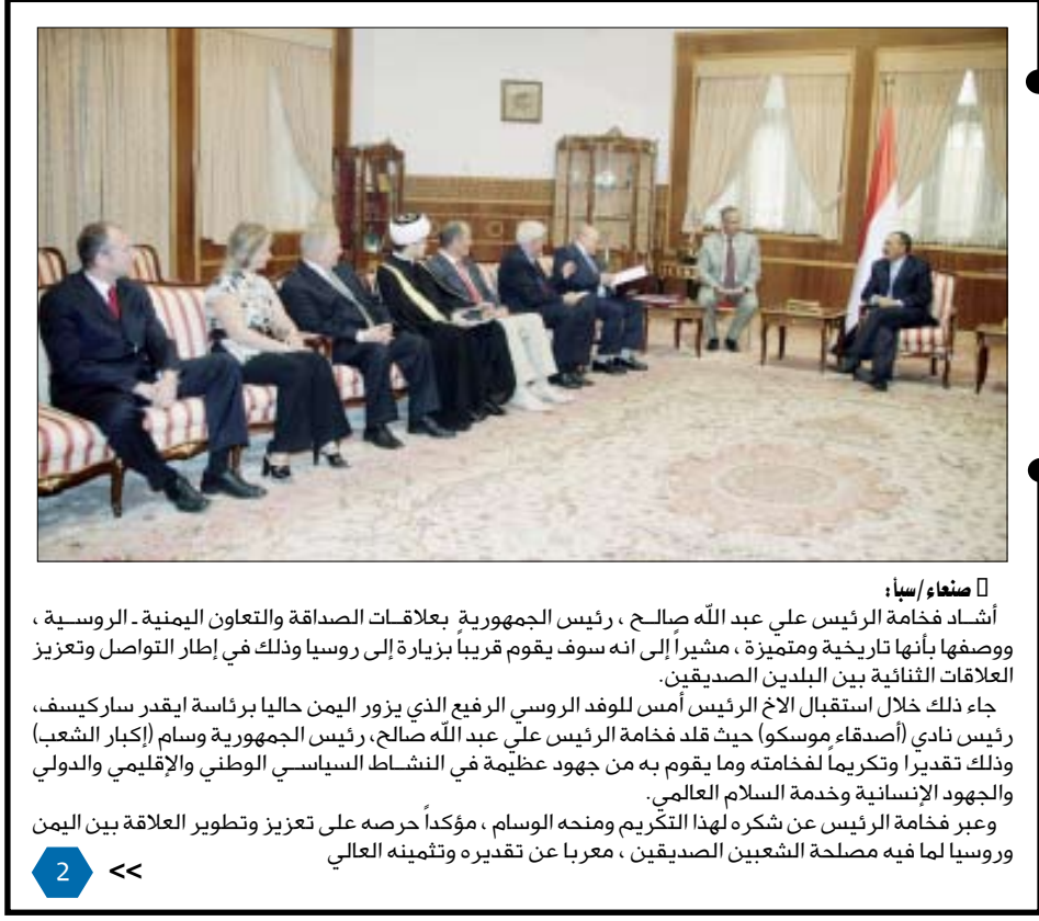
صنعاء/ سبأ: أشاد فخامة الرئيس علي عبد الله صالح، رئيس الجمهورية بعلاقات الصداقة والتعاون اليمنية - الروسية، ووصفها بأنها تاريخية ومتميزة، مشيراً إلى انه سوف يقوم قريبا بزيارة إلى روسيا وذلك في إطار التواصل وتعزيز العلاقات الثنائية بين البلدين الصديقين.