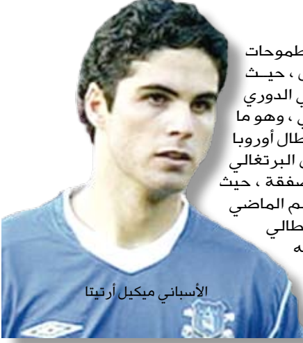
الأسباني ميكيل أرتيتا

في صفوف برشلونه، ويمكن لأتلتيكو أن يلبي طموحات لاعب نادي مدينة ليفر بول، حيث احتل الفريق المركز الرابع في الدوري الأسباني في الموسم الماضي، وهو ما يعني مشاركته في دوري أبطال أوروبا هذا الموسم. ويمكن أن يدخل البرتغالي مانيتشي كجزء من هذه الصفقة، حيث لعب النصف الأخير من الموسم الماضي في صفوف إنتر ميلان الإيطالي على سبيل الإعاره وتبدو عودته إلى أتلتيكو مستحيلة، وكان مانيتشي قد خاض تجربة غير موفقة في الماضي مع تشيلسي الإنجليزي.