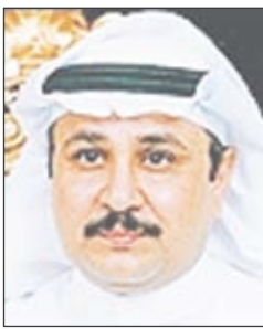
د.عبد العزيز جار الله الجار الله

النجاح الحقيقي هو القبض على الإرهابيين قبل أن ينفذوا مشروعاتهم الإجرامية أو قبل أن يفلتوا من قبضة رجال الأمن.. وإعلان وزارة الداخلية القبض على (520) من أتباع الفكر الضال من جنسيات مختلفة يصب في صالح اليقظة والترقب والمتابعة المستمرة لأجهزة الأمن.. الإرهابيون حددوا أهدافهم غربا في المشاعر المقدسة وشرقا عند منابع النفط وتوسعت دائرتهم ليدخل معهم أجانب بهدف التخريب والحصول على الأموال ويتوقع أن ينضم إليهم مخربون متوقعون وهم تجار المخدرات والمزورون ليجعلوا من بلادنا ساحة للإرهاب والتخريب.