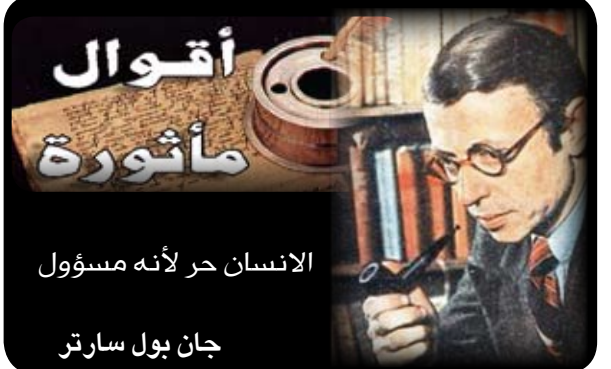
الانسان حر لأنه مسؤول جان بول سارتر