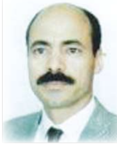
الشاعر التونسي / سالم المساهلي