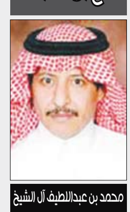
محمد بن عبدالرمان آل الشيخ