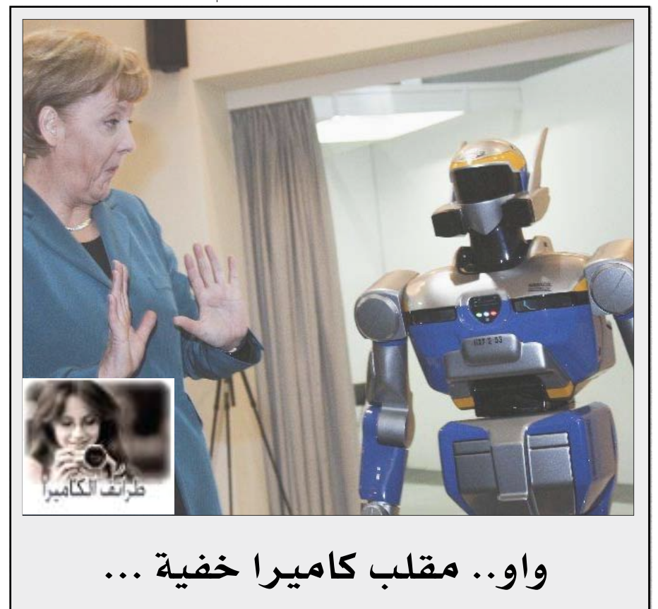
واو.. مقلب كاميرا خفية ...