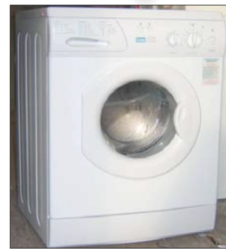
أما غسالة كسيروس فسيتستهلك أقل من 2 في المئة من الماء والكهرباء معاً.

بدأت التكنولوجيا والأدوات الكهربائية المنزلية تتأقلم مع أزمة المياه العالمية، فيفضل جهود الباحثين في جامعة «ليدز» البريطانية نجحت شركة كسيروس في إنتاج جيل جديد من الغسالات التي تحتاج لقطرات معدودة من الماء لغسيل البسطة أبيض ناصع. يكفي كوب من الماء ومسحوق الغسيل وعشرين كيلوغراماً من الرقائق الإلكترونية البلاستيكية التي يمكن إعادة استعمالها لغاية 100 مرة! هنا، تشير الحسابات التقريبية إلى إمكانية غسل البسطة لمدة ستة شهور متواصلة، قبل تغيير هذه الشرائح الإلكترونية، مع تقادي تنشيف البسطة الذي يجلب معه تكلفة إضافية. وتشير التجارب إلى أداء استثنائي لهذه الغسالة، عادة، تحتاج الغسالة التقليدية إلى 35 كيلوغراماً من الماء لكل كيلوغرام واحد من البسطة الموسخة. علاوة على ذلك، ينبغي احتساب كمية الكهرباء المستهلكة لتسخين هذا الماء وتنشيف البسطة بعد الانتهاء من تنظيفها.