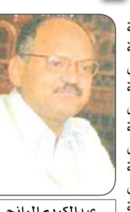
عبد الكريم الرازي

أحزاب بالسخرافة وهمهم بالصرافة الجيد فيهم مقاول يجيد فن اللقافة معه شوية قبائل على شوية لفافة يدور وسط المقائل يمتط مثل الزرافة يمتط كلامه يحاول لفت انتباه الصحافة