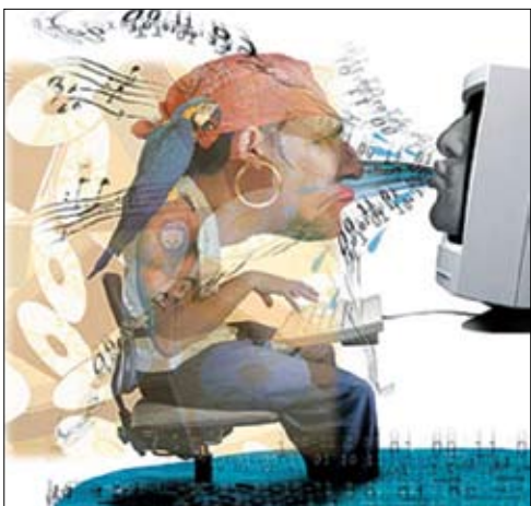
صورة رمزية لحقوق الملكية الفكرية