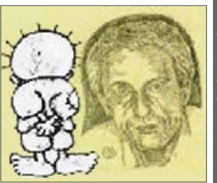
المفكر الفلسطيني ناجي العلي