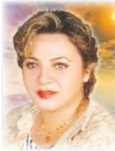
الشاعرة السورية نضال نجار