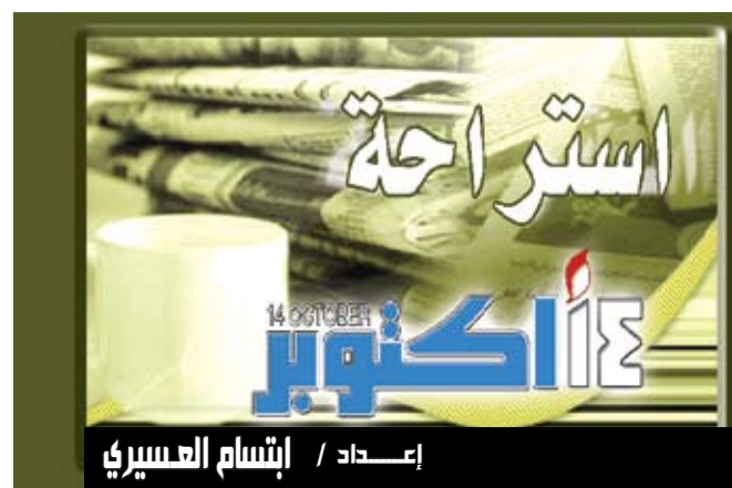
إعداد / إنشام العسيري

يفضل محبو وعشاق الموسيقى البقاء دائماً على اتصال بموسيقاهم، لذلك فقد ساعدتهم مشغلات الموسيقى الرقمية MP3 على التعايش مع ذلك النمط من العيش الذي يحبونه. وقد اختلفت تلك المشغلات في طريقة وأسلوب عملها لتتيح قدرات أكبر تسمح باستغلال كافة الأوقات للاستمتاع بالأجواء الموسيقية التي توفرها وذلك من خلال توفير حرية التنقل، والاتصال اللاسلكي، وتقليص الحجم ليصبح المشغل من الخفة بحيث لا يشعر به