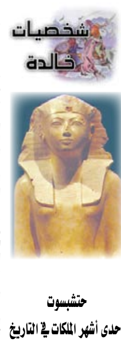
حتشيسوت إحدى أشهر الملكات في التاريخ

في إحدى النساء القلائل اللاتي اعتلين عرش مصر و أدارت مقاليد الحكم باقتدار جعل التاريخ يخلد ذكرها حتى الآن. 1482 ق.م) إحدى أشهر الملكات في التاريخ، وخامس فراغة الأسرة الثامنة عشرة، وحكمت من 1503 ق.م. حتى 1482 ق.م. وتميز في عهدها بقوة الجيش والبناء والحالات التي قامت بها وهي الابنة الكبرى لفرعون مصر الملك تحتموس الأول وأنها الملكة أحمس وكان أبوها الملك قد أنجب ابناً غير شرعي هو تحتمس الثاني وقد قبلت الزواج منه على عادة الأسر الملكية ليشراكا معاً في الحكم بعد موته، وذلك خلا لمشكلة وجود وريث شرعي له. هذه الملكة تركت الأثار كثيرة وأسراها وربما يكون أكثر تلك الأثار إثارة شخصية سنوت ذلك المهندس الذي بنى لها معبدها الشهير في الدير البحري والذي منحه 80 لقباً وكان مسلولاً عن رعاية ابنتها الوحيدة وقد بلغ من حبه لملكته أن حفر نفقاً بين مقبرتها ومقبرته، وإذا جاءت تلميحات المؤرخين لتشير إلى وجود حالة حب قد جمعت الاثنين سنوت وحتشيسوت فإنهما الملكة وخادماها أيضاً قد شاركوا في حياة أسطورية وانتهى كل منهما نهاية غامضة