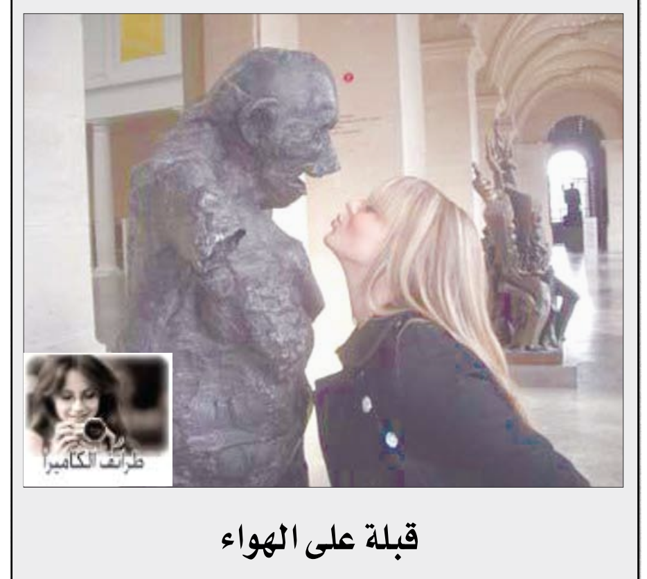
قبلة على الهواء

كلمات أفقياً نزاع قام بين تشيلي وجارتها بوليفيا وبيرو حول ملكية مناجم النحاس أدت إلى انتصار تشيلي وانتزاعها مقاطعة اتاكاما من بوليفيا ومقاطعتي أريكا وتاكتنا من بيرو وحرمت بوليفيا من أي منفذ على الباسيفيك. اله النار عند الرومان - مقدار. عملة - يعمر - للتنمي. مدينة قديمة على سيردريا الأوسط يقول المسعودي ان عدد سكانها بلغ سبعين ألفاً - والد. عقل - من سور القرآن الكريم. عقائد - قريب. معاهدة - فعل ماض ناسخ. حرف نصب - لهو - أحرف متشابهة. دار - من أطوار القمر - بلخ. شهر ميلادي - من أودية بلادنا - شهر سرياني. تقيض يذم - بلد عربي. جمع سنه - في العروق - من المعادن. عمودياً صوت أوراق الأشجار - جماعات كثيرة متفرقة. لاعب كرة قدم برازيلي في صفوف برشلونة الأسباني. حل العدد الماضي