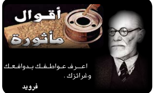
اعرف عواطفك بدوافعك وغرائبك. فريد

لأطفال الفقراء لدى مخفر الشرطة. وبالفضل، وافق الطفل بكل سلامة نية بالنتيرع بمصاضته للفقراء، لكن مفاجأة كبرى كانت بانتظار الأم، إذ اكتشفت في الحال أنه يحتفظ بمصاصة ثانية في عيبته، الأمر الذي