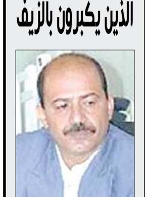
الذين يكبرون بالريف

بعض الأفراد - خصوصاً المحسوبين على الفئة المثقفة - يكبرون بالريف... ورغم أن لديهم مؤهلات أخرى جيدة تساعدهم على الارتقاء بمكانتهم، إلا أنهم يفضلون الارتفاع إلى أعلى عن طريق سلم الريف، ومع ذلك يتحججون.