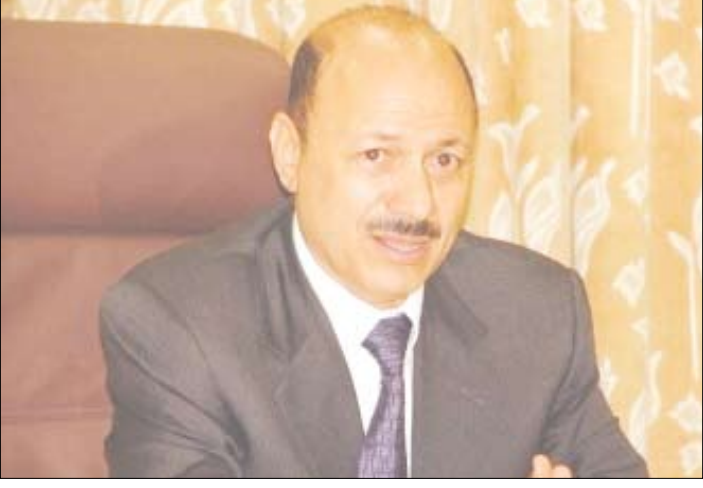
د. رشاد العليمي