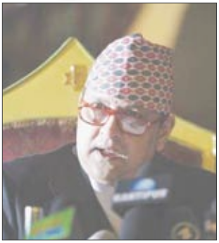
الملك النيبالي المخلوع جيانيندرا

الآن كمواطن عادي في أحد قصوره السابقة المخصصة للصيد خارج كاتمندو. بدأت الحكومة النيبالية الأحد الماضي مشروعاً لإقامة متحف داخل القصر المتعدد الأسقف سيعرض فيه تاج الملك المرصع بالجواهر وصلواته وعرشه والتحف الملكية الأخرى. ومن بين التحف التي سيضمها المتحف سيارة مرسيدس بنز موديل عام 1939 قدمها الزعيم النازي أدولف هتلر لجد ملك نيبال السابق عام 1940. ومن المقرر افتتاح المتحف أمام الجمهور خلال شهرين.