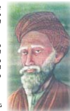
المسعودي مؤرخ وعالم جغرافي عربي