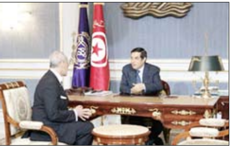
الرئيس زين العابدين

تربيت الوطني. وقال وزير الدولة للتنمية الإدارية "إن الوزارة طلبت من كافة الجهات الإدارية الإسراع في تسليم هذه الاستمارات بعد ملئها وذلك إما ورقيا أو إلكترونيا وحرصا على سلامة عمليات التخطيط لكافة مجالات شئون التوظيف". وتعد حركة الترقىات هذه السابعة من سلسلة حركات الترقىات الجماعية للعاملين المدنيين بالدولة حيث سبق تنفيذ 6 حركات للترقىات على مدى سبع سنوات. وأشار الوزير إلى أنه سيرا على إجراء حركة الترقىات الجماعية للعاملين بذات الشروط والأوضاع والمميزات الوظيفية المعمول بها في حركات الترقىات السابقة لموظفي الدولة مراعاة للعائلة والمساواة ووحدة المعاملة. وكان قد تم بالفعل الإجماع المالي المطلوب لإتمام الترقىات لموعدها وينتظم رفع الدرجات بالاتفاق مع وزارة المالية عند إعداد الموازنة التي تم عرضها على مجلس الشعب لعام 2009 / 2008. كما سوف يتم إعداد كشوف المستحقين للترقىة من واقع الاستثمارات التي وصلت بالفعل للوزارة من الجهات المختلفة ، وسيتم إرسال البيان إلى الجهاز المركزي للتنظيم والإدارة ليصدر رئيس الجهاز قراره بالترقىة.