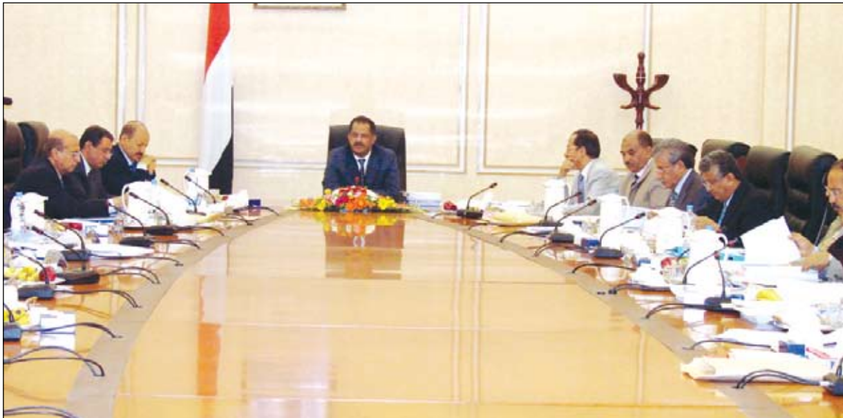
المنصرم ، وآخر عن مشاركته في اجتماع مجموعة العمل الخاصة بالبنسنة الرائدات الذي انعقد في اليونان خلال شهر يونيو الجاري.

فخامة الأخ الرئيس علي عبدالله صالح رئيس الجمهورية قيادتي البلدين الجارين إلى اعتماد الحوار وسيلة لحل الخلاف الحدودي بينهما حفاظاً على علاقات الجوار وعلى أمن واستقرار المنطقة وتجنّبها المزيد من الصراعات التي تضر بالمنطقة بوجه عام وبغلاقت البلدين الجارين بشكل خاص.