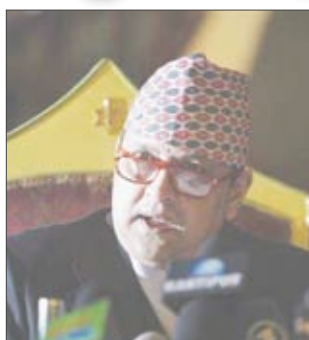
الملك النيبالي المخلوع جيانيندرا

الآن كمواطن عادي في أحد قصوره السابقة المخصصة للصيد خارج كاتمندو. بدأت الحكومة النيبالية الأحد الماضي مشروعاً لإقامة متحف داخل القصر المتعدد الاسقف سيرض فيه تاج الملك المرصع بالجواهر وصولجانه وعرشه والتحف الملكية الأخرى. ومن بين التحف التي سيضمها المتحف سيارة مرسيدس بنز موديل عام 1939 قدمها الزعيم النازي أدولف هتلر لجد ملك نيبال السابق عام 1940. ومن المقرر افتتاح المتحف أمام الجمهور خلال شهرين.