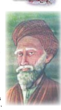
المسعودي مؤرخ وعالم جغرافي عربي