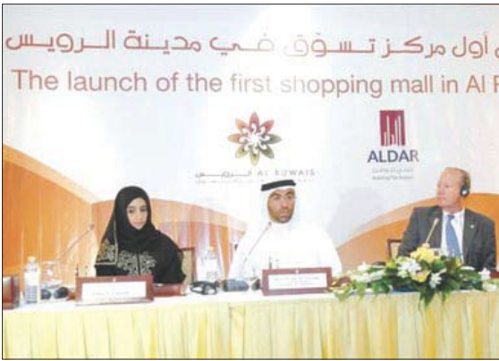
الدار العقارية تطلق مركزا للتسوق في الرويس