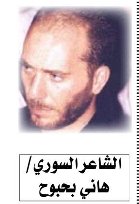
الشاعر السوري / هاني بابووح