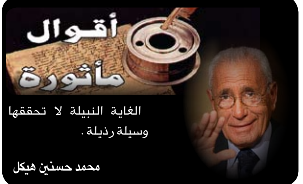
محمد حسين هيكل

التي يتكبدونها من أجل زيادة انتاجها من هذا الحليب. أعرب بوتين عن دهشته ثم عن سخطه وغضبه حين علم أيضاً في الاجتماع الأخير للحكومة الروسية أن أسعار الحليب الذي يُقدم للماشية شرباً ووضن به على المستهلك، في تزايد مستمر بسبب قوانين العرض والطلب، على حد قول وزير الزراعة اليكسي غورديف!