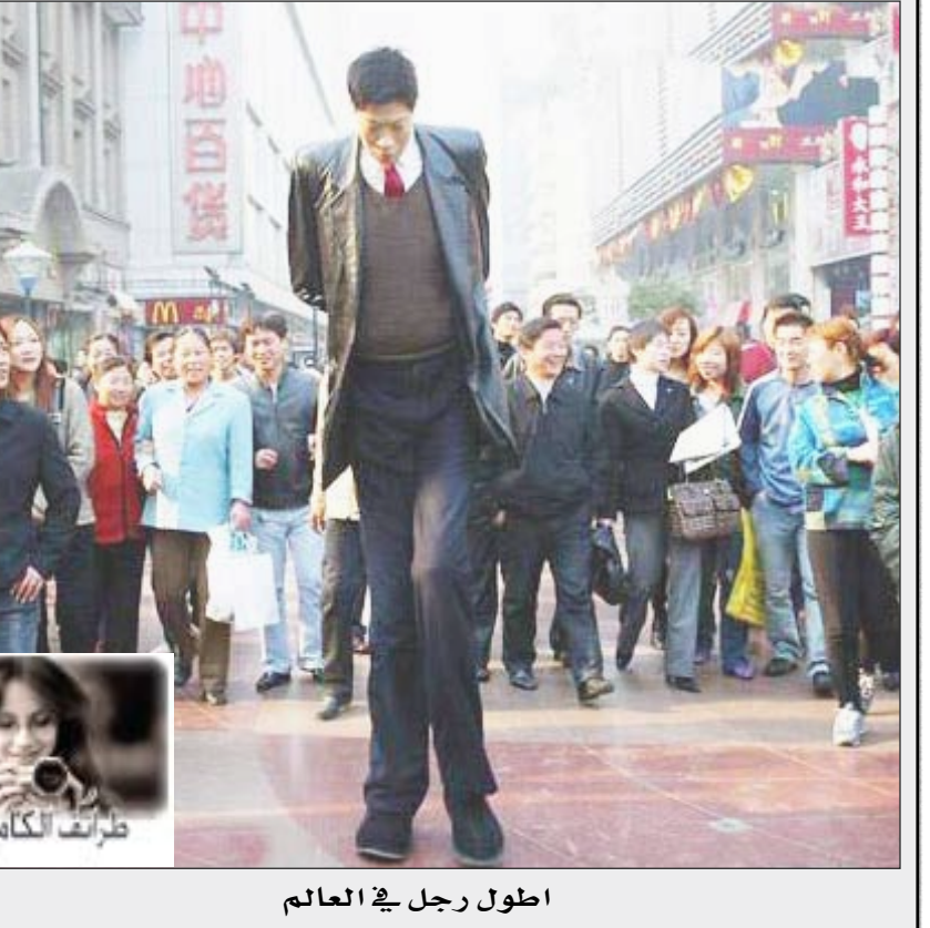
اطول رجل في العالم