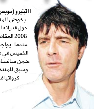
المدرّب الألماني يواكيم لوف

يخوض المنتخب الألماني امتحاناً جدياً حول قدرته للذهاب بعيداً في كأس أوروبا 2008 المقامة حالياً في سويسرا والنمسا عندما يواجه نظيره الكرواتي اليوم الخميس في مدينة كلاغنفورت النمساوية ضمن منافسات المجموعة الثانية. وسبق للمنتخب الألماني أن واجه منتخب كرواتيا في ربع نهائي البطولة القارية عام 1996 وفاز عليه 2-1 في طريقه إلى إحراز اللقب، لكن المنتخب البلقاني انتظر سنتين ليثأر بقوة عندما سحق نظيره الألماني 3-0.