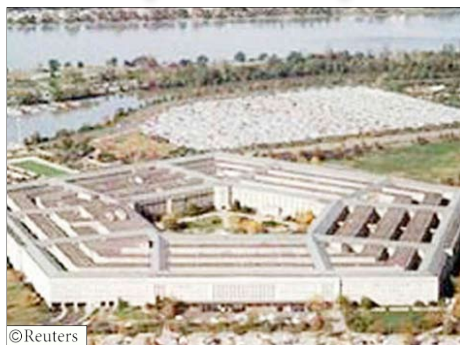
مبنى البنتاجون الأمريكي