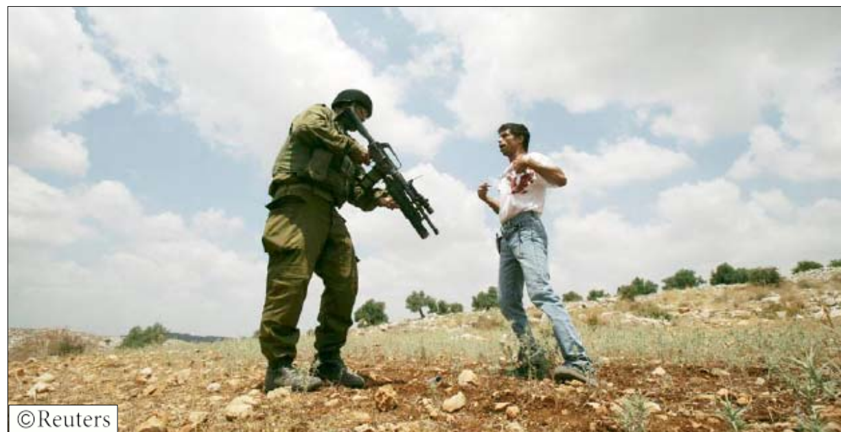
صورة من الاذلال الاسرائيلي للفلسطينيين

على صعيد آخر قال رئيس الوزراء الفلسطيني سلام فياض أمس الأربعاء إنه يعتقد أنه سيكون من المستحيل الوصول لاتفاق للسلام مع إسرائيل هذا العام. ولم تظهر المحادثات بشأن الدولة الفلسطينية تقديما يذكر منذ بدئها في مؤتمر بأنابوليس بولاية ماريلاند الأمريكية في نوفمبر. وكانت واشنطن قد أعربت عن أملها في الوصول لاتفاق إطار قبل ترك الرئيس الأمريكي لمنصبه في يناير 2009. ولكن فياض أشار إلى بناء إسرائيل للمستوطنات في الضفة الغربية بوصفه عقبة في طريق إحراز تقدم