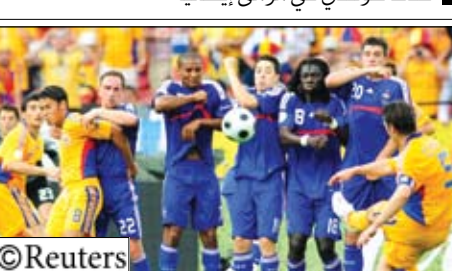
لقطة من مباراة فرنسا ورومانيا

بيرن/ 14 أكتوبر / منوعات وكالات - مني المنتخب الإيطالي بخسارة كبيرة أمام نظيره الهولندي (3-0)، في المباراة التي جمعت بينهما يوم أمس ضمن مباريات الجولة الأولى للمجموعة الثالثة ضمن الدور الأول من نهائيات بطولة كأس الأمم الأوروبية لكرة القدم، التي تستضيفها كل من سويسرا والنمسا. إلى ذلك استهل المنتخب الفرنسي وصيف بطل مونديال 2006 مشواره بتعادل «بهاجم» مع نظيره الروماني صفر - صفر يوم أمس الإثنين على ملعب «ليتزغروند شتاديون» في زيوريخ في افتتاح منافسات المجموعة الثالثة من الدور الأول لكأس أوروبا لكرة القدم التي تستضيفها النمسا وسويسرا حتى 29 الشهر الحالي.