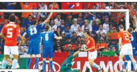
هدف هولندي في مرمرى إيطاليا