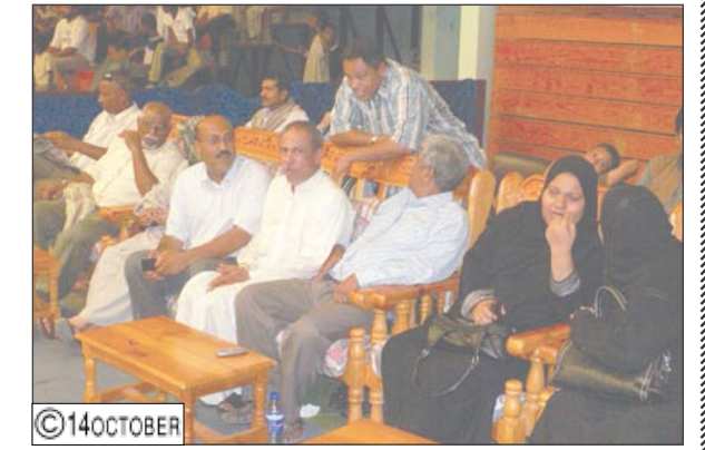
لقطات من البطولة