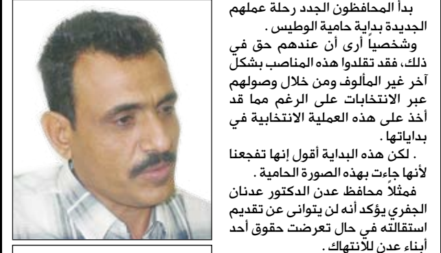
فضل علي مبارك

بدأ المحافظون الجدد رحلة عملهم الجديدة بداية حماية الوطن. وشخصياً أرى أن عندهم حق في ذلك، فقد تقلدوا هذه المناصب بشكل آخر غير المألوف ومن خلال وصولهم عبر الانتخابات على الرغم مما قد أخذ على هذه العملية الانتخابية في بداياتها. لكن هذه البداية أقول إنها تفجعنا لأنها جاءت بهذه الصورة الحامية. فمثلاً محافظ عدن الدكتور عدنان الجفري يؤكد أنه لن يتوانى عن تقديم استقالته في حال تعرضت حقوق أحد أبناء عدن للانتهاك. والمهندس أحمد الميسري محافظ أبين أعطى نفسه مهلة شهرين لإحداث التغيير ما لم فإنه سيرتك المنصب. ومحافظ تعز حمود خالد الصوفي كانت خطواته مغايرة بأن أبتعد عن القول وقام بتغيير رؤساء الأقسام ومديري إدارات مكتب التربية والتعليم. وشدد محافظ شبوة الدكتور علي حسن الأحمدى على ضرورة ضبط المخالفين والمطلوبين للعدالة وهدد الأحمدى بسحب المشاريع التي تجاوزت مدة إنجازها الفترة المحددة ولم ينفذها المقاولون. وأكد أمين العاصمة عبد الرحمن الأوكوع على ضرورة التكامل والتنسيق بين كافة الجهات لحل كل القضايا والاختصاصات حسب الدستور والقانون والعمل بروح الفريق الواحد بما يخدم المصلحة العامة وخدمة الوطن. ولم يشد بقية المحافظين عن القاعدة التي بدأ بها زملاؤهم. ومن يقف على فتوى تلك الخطوات باستثناء تعز باعتبارها جاءت فعلاً لا قولاً فإنه إذا ما تحقق 50٪ من تلك الوعود والتي نعلم جيداً أن في جعبة أصحابها كثير من التطلعات التي تمنى أن تغدو برامج عمل فيما لا شك فيه أن جميع المحافظات سوف تشهد نقلة نوعية وغير مسبوقه أرتكازاً أعلى ما نلمسه في "نيات" هؤلاء المحافظين من منطلق إنما الأعمال بالنيات. وحتى يتحقق للناس ثمر على أرض الواقع فإننا نقول إن العبرة عادة بالهالية.