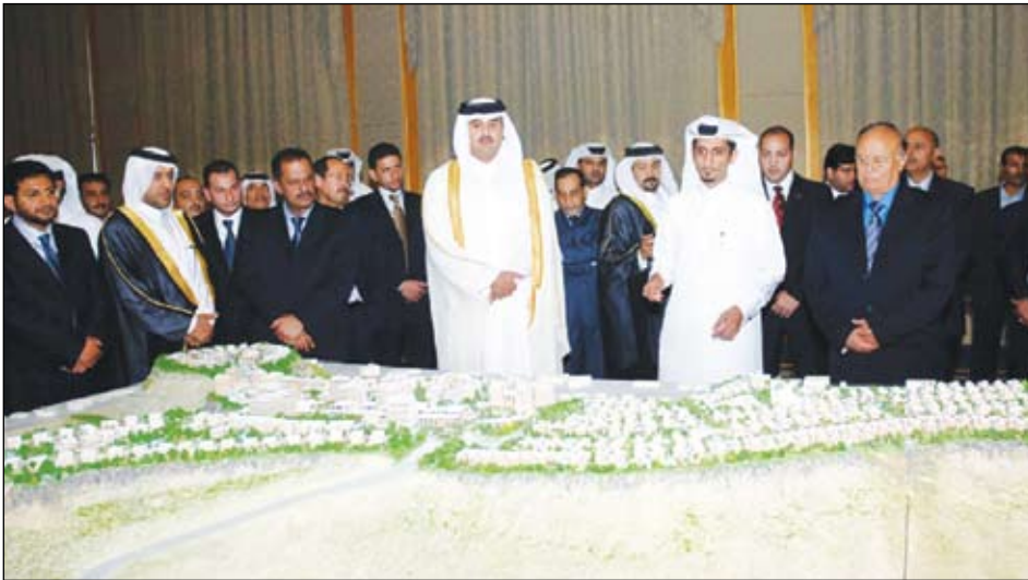
صنعاء / سيا :

حضر الأخ عبد ربه منصور هادي ، نائب رئيس الجمهورية مع أخيه سمو الشيخ تميم بن حمد آل ثاني ولي العهد بدولة قطر الشقيقة والكتور علي محمد مجبور رئيس مجلس الوزراء حفل تدشين المشروع السياحي العقاري (تلال الريان) أحد مشاريع شركة الديار القطرية. ويعد مشروع تلال الريان أكبر مشروع سياحي وعقاري حتى الآن في اليمن حيث يساهم على قمة جبل فح عطان في أمانة العاصمة بمساحة تبلغ حوالي خمسمائة ألف متر مربع وبتكلفة استثمارية تقدر بنحو 560 مليون دولار. وفي حفل تدشين المشروع ألقى الأخ صلاح العطار، رئيس الهيئة العامة للاستثمار كلمة رحب فيها بسمو الشيخ