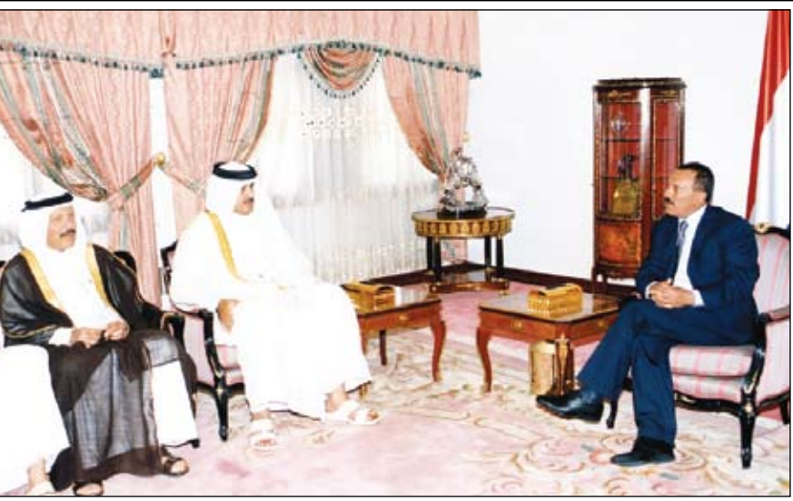
صنعاء / سيا :

استقبل فخامة الأخ الرئيس علي عبدالله صالح رئيس الجمهورية أمس ومعه الأخ عبد ربه منصور هادي نائب رئيس الجمهورية سمو الشيخ تميم بن حمد بن خليفة آل ثاني ولي عهد دولة قطر الشقيقة الذي يزور بلادنا حالياً ، ونقل لفخامة الأخ الرئيس تحيات أخيه سمو الشيخ حمد بن ثاني أمير دولة قطر وتمنياته له بموفق الصحة والسعادة ولشعبنا اليمني مزيداً من التقدم والأزهار . وجرى خلال المقابلة تناول العلاقات الأخوية والتعاون المشترك بين البلدين ومنها التعاون في المجال الاستثماري بالإضافة إلى تناول الأوضاع في المنطقة . كما جرى الحديث حول مشروع الريان السياحي الاستثماري الذي تم تشييته أمس بتكلفة 560 مليون دولار. وقد أشاد فخامة الأخ الرئيس بمستوى العلاقات الأخوية بين اليمن ودولة قطر، مؤكداً الحرص على تعزيزها وتطويرها ولما فيه تحقيق المصالح المشتركة للبلدين .. مجدداً الترحيب بالاستثمارات