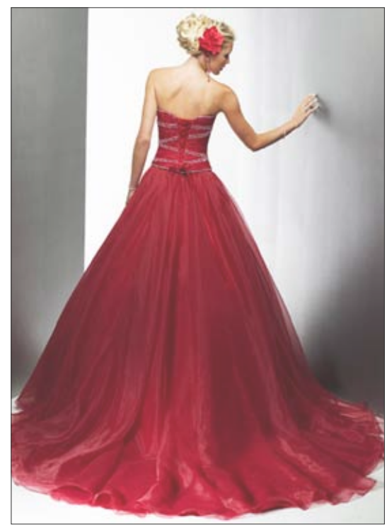
صورة من الخلف تظهر مسامة اللب وبقعة الظهر للفتاة

تقولين أنك أزلت الالتهابات بجراحة وهذا معناه أن الالتهابات كانت في الجزء الأعلى من الجهاز التناسلي و أي منطقة الأنابيب والمبايض ، وهذا يرجح أن المشكلة لديك في أنابيب أو قنوات فالوب أكثر من التبويض، لذا يجدر بك إجراء فحص طبي للتأكد من أن قنوات فالوب غير مسدودة وتؤدي وظيفتها جيدا حتى يحدث الحمل . ولكنك لم تذكر شي شيئا عن صحة سائل زوجه المنوي ، فهل تعلمين أن 30% من عوامل تأخر الإنجاب يكون السبب فيها الرجل؟ كما أن الصحيح طبيا أن فحص تأخر الإنجاب يبدأ بتحليل الزوج لأنه الأوضح والأسهل وعلاجه معروف ، أما المرأة فليبدأ أكثر من فحص فهناك احتمال أن تكون المشكلة بقنوات فالوب أو الرحم نفسه ، مما يتطلب تحاليل وأشعات كثيرة .