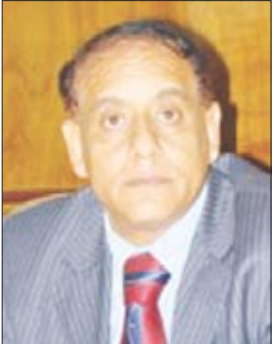
د. الحضرائي رئيس جامعة ذمار

مخزون هائل من الدلالات الحسية والنصية في البناء النصي لها. وأضاف الدكتور الحضرائي أنه سيقام على هامش المهرجان ثلاثة معارض الأول للكتاب بمشاركة أكثر من ثمانين دور نشر محلية والثاني للفنون التشكيلية تعرض فيه عشرات اللوحات الفنية لطلاب الفنون التشكيلية بكلية التربية. بينما خصص المعرض الثالث لأعمال طلاب كلية الهندسة بالجامعة، إضافة إلى أن هناك وصلات فنية تتخلل المهرجان تتغنّى بالوحدة اليمنية تقدمها فرقة الفنون بحفاظة ذمار.