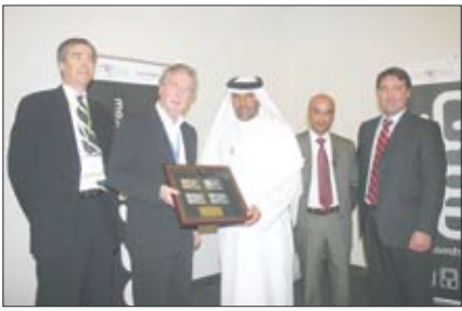
خلال إعلان تأسيس مشروع مشترك لإحلال الإعلام الرقمي

تزويد الجمهور في المنطقة بعروض ترفيهية ذات قيمة منافسة عبر الأجهزة التي يرغبون بها. وأضاف أن إعلان تأسيس «جيتمو العربية» جاء خلال معرض «ميكوم» المقام حالياً بمركز أبوظبي الوطني للمعارض عقب توقيع مذكرة تفاهم بين «شركة أبوظبي للإعلام» ومجموعة برتلسمان، تم الاتفاق بموجبها على عدد من المبادرات الإستراتيجية. ورافق هذا الإعلان استعراض لخدمات الإعلام الرقمي التي سيتم توفيرها كما ستنتج «جيتمو العربية» لشركائها القدرة على تزويد عملائهم بمجموعة متنوعة من خدمات الموسيقى والأفلام والألعاب والترفيه الترفيهي والتي يمكن الاستمتاع بها في أي وقت عبر مختلف الأجهزة ابتداءً من أجهزة الهواتف المتحركة وحتى الكمبيوترات الشخصية المرتبطة بالإنترنت السريعة، بالإضافة إلى أجهزة الربط والاستقبال. وقال إيدي بورجرانديج الرئيس التنفيذي لشركة أبوظبي للإعلام أن الشركة تحرص على رصد التوجهات المستقبلية في السوق وتوفير الحلول الإبداعية التي تلبي متطلباتها المتعددة.