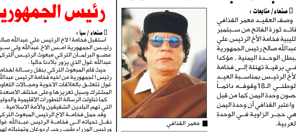
صنعاء / متابعيات : وصف العقيد معمر القذافي قائد ثورة الفاتح من سبتمبر الليبية فخامة الأخ الرئيس علي عبدالله صالح رئيس الجمهورية ببطل الوحدة اليمنية ، مؤكداً في برقية تهنئة إلى فخامة الأخ الرئيس بمناسبة العيد الوطني الـ18 ووقوفه دائماً لصون وحدة اليمن كما من قبل ، واعتبر القذافي أن وحدة اليمن هي حجر الزاوية في الوحدة العربية.