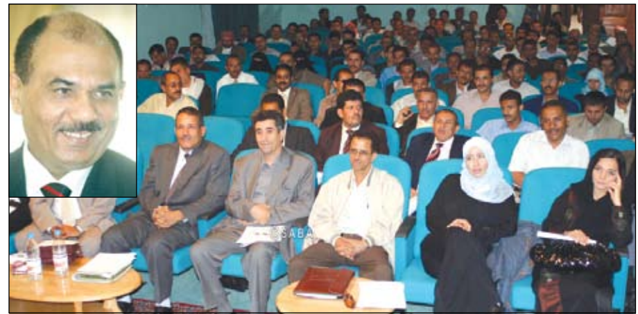
جانب من حضور منح درع وزارة الإعلام لصحيفة (العرب) اللندنية وفي الإطرا وزير الإعلام