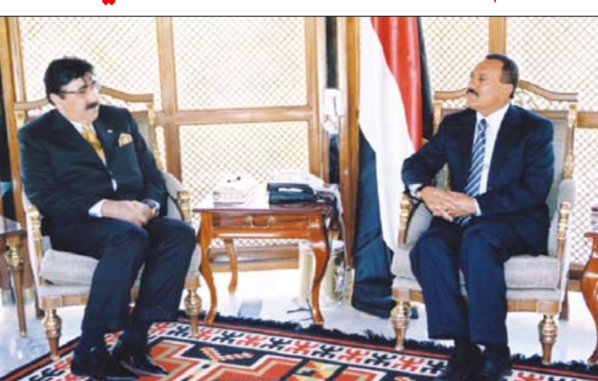
صنعاء / سيا : استقبل فخامة الاخ الرئيس علي عبدالله صالح رئيس الجمهورية امس الاخ عبدالله ولي سيد عضو البرلمان التركي مبعوث الرئيس التركي عبدالله غول الذي يزور بلادنا حالياً. حيث قام المبعوث التركي بنقل رسالة لفخامة رئيس الجمهورية من اخيه فخامة الرئيس عبدالله غول تتعلق بالعلاقات الاخوية ومجالات التعاون المشترك وسبل تعزيزها وعلى مختلف الاصعدة. كما تناولت الرسالة التطورات الاقليمية والدولية التي تهم البلدين الشقيقين والامة الاسلامية. وقد حمل فخامة الاخ الرئيس المبعوث التركي نقل تحياته الى فخامة الرئيس عبدالله غول ورئيس الوزراء طيب رجب اردوغان وتمنياته لهما بموفقو الصحة والسعادة وللشعب التركي الشقيق مزيداً من التقدم والازدهار. وأشاد بدور تركيا في الدفع بجهود تحقيق السلام في المنطقة وخدمة القضايا الاسلامية. حضر المقابلة الاخ عبدالله حسين البشيرى امين عام الرئاسة والدكتور سمير رضا خيري عضو مجلس النواب وتوريل اكرارول سفير تركيا لدى بلادنا.