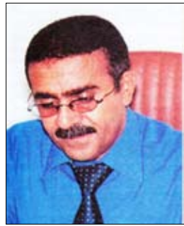
محمد عبد التواب الخرساني

العام إنها تأتي تزامناً مع تحقيق مكسب وطني جديد يضاف إلى رصيد إنجازات القيادة السياسية للبلاد ويتمثل بانتخابات المحافظين التي تعتبر بالفعل خطوة عملية وجادة نحو توسيع صلاحيات الحكم المحلي، حيث ستقل على أثرها الصلاحيات للسلطة المحلية وبالتالي الانتقال إلى حكم محلي واسع الصلاحيات، ليكون بذلك قد حقق فخامة الأخ/ علي عبدالله صالح رئيس الجمهورية (حفظه الله) أحد الوعود التي تضمنها برنامجه الانتخابي. وفي الأخير لا يسعنا إلا أن نتقدم بخالص التهاني والصدق والتبريكات لقيادتنا السياسية ولشعبنا اليمني الأبي كافة، متمنين من العلي القدير أن يديم علينا وحدتنا وتماسكنا، وأن يعيد علينا هذه المناسبة.. وقد تحقق للوطن المزيد من المكاسب الوطنية والتنمية.