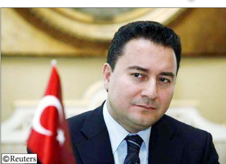
وزير خارجية تركيا